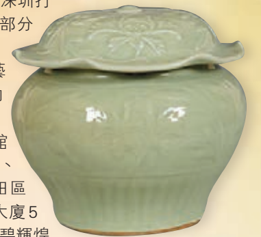
■元代龍泉窯荷葉蓋罐