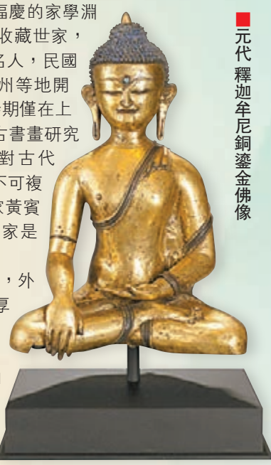
■元代釋迦牟尼銅鎏金佛像

在他看來，將博物館事業做好，不僅僅是他作為一名企業家的社會責任，也是通過保護和傳承傳統文化從而為國家贏得尊重的，每一個中國人的責任。「中國是五千年文明的文化大國，我們的文物是為了讓人們明白文化的價值所在和祖先高度的智慧在哪裡。」