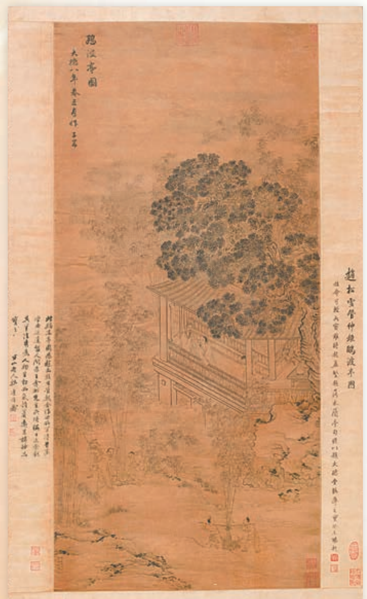
■元代大書畫家趙孟頫與夫人管道昇合繪的《鷓鴣亭圖》

此外，當代木雕大師蒯正華將展出其金獎作品《蘭亭雅集》及另一精品《87神仙圖》。至正藝術博物館還將重磅推出馬欣榮、宰賢文、程樂萍3位中青年簽約畫家作品並請3位藝術大咖現場作畫。