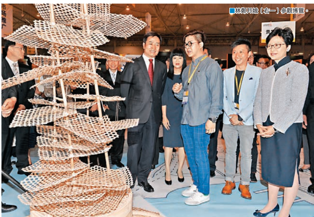
林鄭月娥(右一)參觀博覽。

香港文匯報訊(記者 鄭治祖)由香港貿易發展局、中共四川省委統戰部、四川省發展和改革委員會、四川省經濟和信息化委員會、四川省科學技術廳、四川省商務廳、四川省人民政府港澳事務辦公室共同主辦的「創新升級·香港博覽」(SmartHK),昨日在成都世紀城新國際會展中心盛大揭幕。這是香港貿易發展局於四川舉辦的首個大型服務業旗艦推廣活動,吸引逾150家、遍及20多個行業的香港服務業代表及機構參與。博覽重點推介各類有助企業創新升級的設計及市場推廣、管理及科技創新的服務,探討「一帶一路」機遇,讓兩地企業互補優勢,共拓商機。