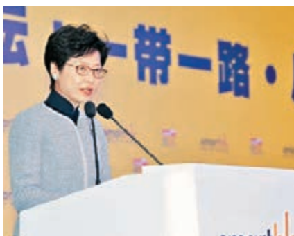
林鄭月娥在「創新升級·香港博覽」上致辭。

香港文匯報訊(記者 李兵 成都報道)特區政務司司長林鄭月娥昨日在四川成都出席貿易發展局舉辦的香港博覽CEO論壇開幕式。她致辭時表示,特區政府致力協助香港企業配合國家政策轉型升值,並成立10億元專項基金,資助港資企業在內地推行項目,開拓和發展內地市場,截至今年3月底,共有580宗申請獲批資助,涉款3.7億元。