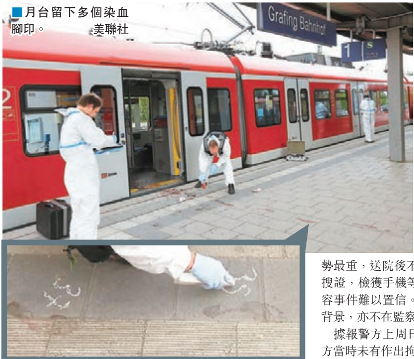
月台留下多個染血腳印。

歐洲仍然籠罩在恐襲陰霾之際，德國昨日發生斬人案，一名27歲男子闖入慕尼黑東南部小鎮格里芬一個火車站，揮刀襲擊途人，造成1死3傷，其中一人情況危殆。有目擊者透露，兇徒曾叫喊「真主至大」及「你們這些異教徒」等字句。經初步調查後，巴伐利亞內政部長赫爾曼指，未有證據顯示事件涉及宗教和恐怖主義，又透露兇徒有精神問題和吸毒前科。