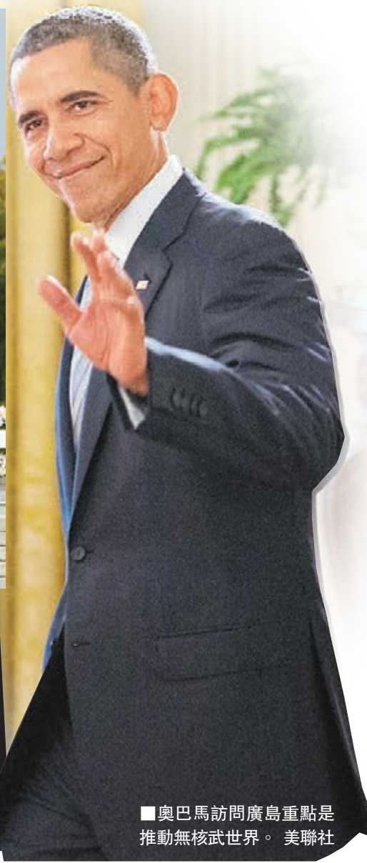
奧巴馬訪廣島重點是推動無核武世界。