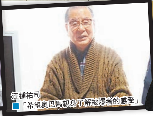
江種祐司 「希望奧巴馬親身了解被爆者的感受」