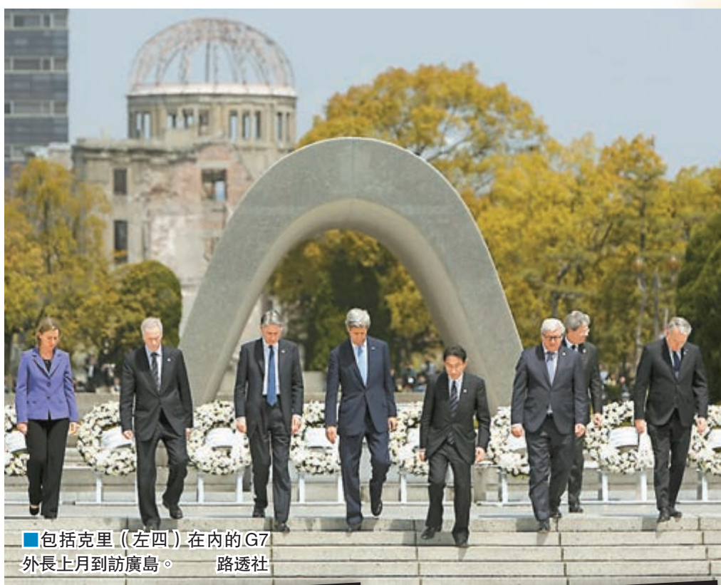
包括克里(左四)在內的G7外長上月到訪廣島。