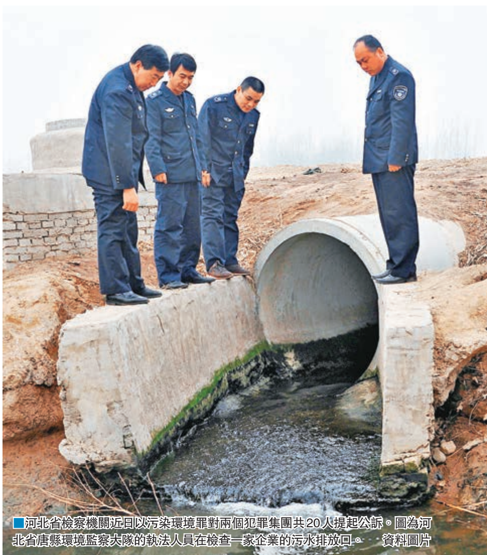
河北省檢察機關近日以污染環境罪對兩個犯罪集團共20人提起公訴。圖為河北省唐縣環境監察大隊的執法人員在檢查一家企業的污水排放口。資料圖片

離犯罪團夥最後一次偷排已過去近一年，當地環保部門進行無害化處理後，如今各排污點已不見被污染的痕跡，但強鹼、強酸，其下滲已不可挽回。