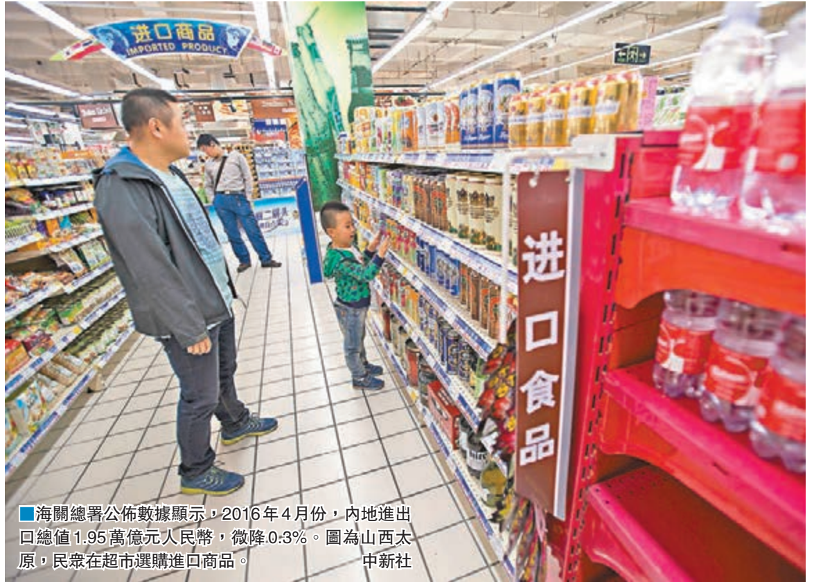
海關總署公佈數據顯示,2016年4月份,內地進出口總值1.95萬億元人民幣,微降0.3%。圖為山西太原,民眾在超市選購進口商品。