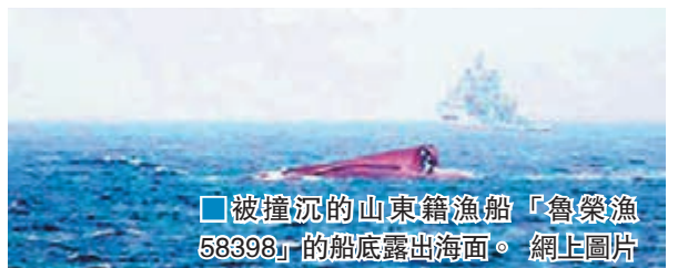
被撞沉的山東籍漁船「魯榮漁58398」的船底露出海面。

事故發生後,海事部門立即對嫌疑船舶進行排查,並迅速組織力量攔截。5月7日21時30分,嫌疑船舶已到達指定地點錨泊並接受調查。調查人員已對嫌疑船舶進行了現場勘驗,對相關人員進行了調查詢問,並調取了嫌疑船舶航行記錄儀等重要信息和失事漁船航行軌跡等資料,事故調查工作正在積極推進中。