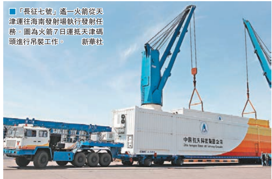
「長征七號」遙一火箭從天津運往海南發射場執行發射任務。圖為火箭7日運抵天津碼頭進行吊裝工作。

香港文匯報訊(記者何政海口報道)「長征七號」遙一火箭昨日從天津港啟程,將於5月中旬抵達海南文昌發射場,預計6月下旬實施發射。本次發射是載人航天工程空間實驗室階段4次飛行任務的開局之戰,也是中國新建成的海南發射場首次執行發射任務。據悉,今年中國全面實施載人航天工程空間實驗室任務,除了「長征七號」外,運載能力更大的「長征五號」火箭也將在今年執行首飛任務。