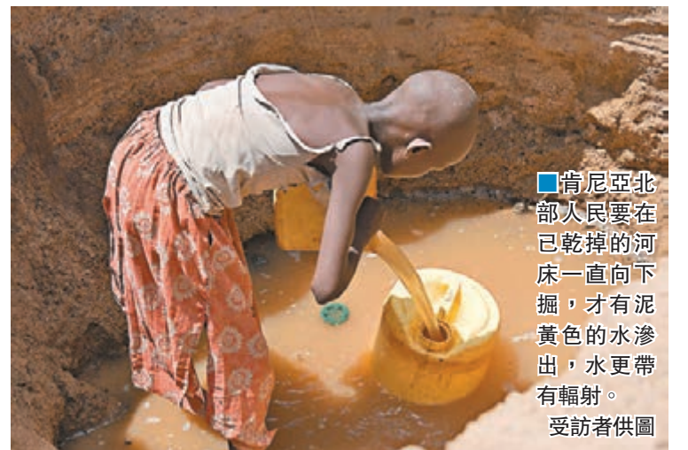
■肯尼亞北部人民要在已乾掉的河床一直向下掘,才有泥黃色的水滲出,水更帶有輻射。