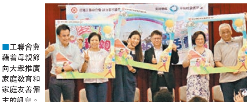
■工聯會冀藉着母親節向大眾推廣家庭教育和家庭友善僱主的訊息。

他續說,政府積極推動母乳餵哺,本港的母乳餵哺率於過去20年持續上升,出院時的母乳餵哺率由1992年的19%,大幅提高至2014年的86%,但於嬰兒4個月大時仍持續餵母乳的比率只有約兩成。