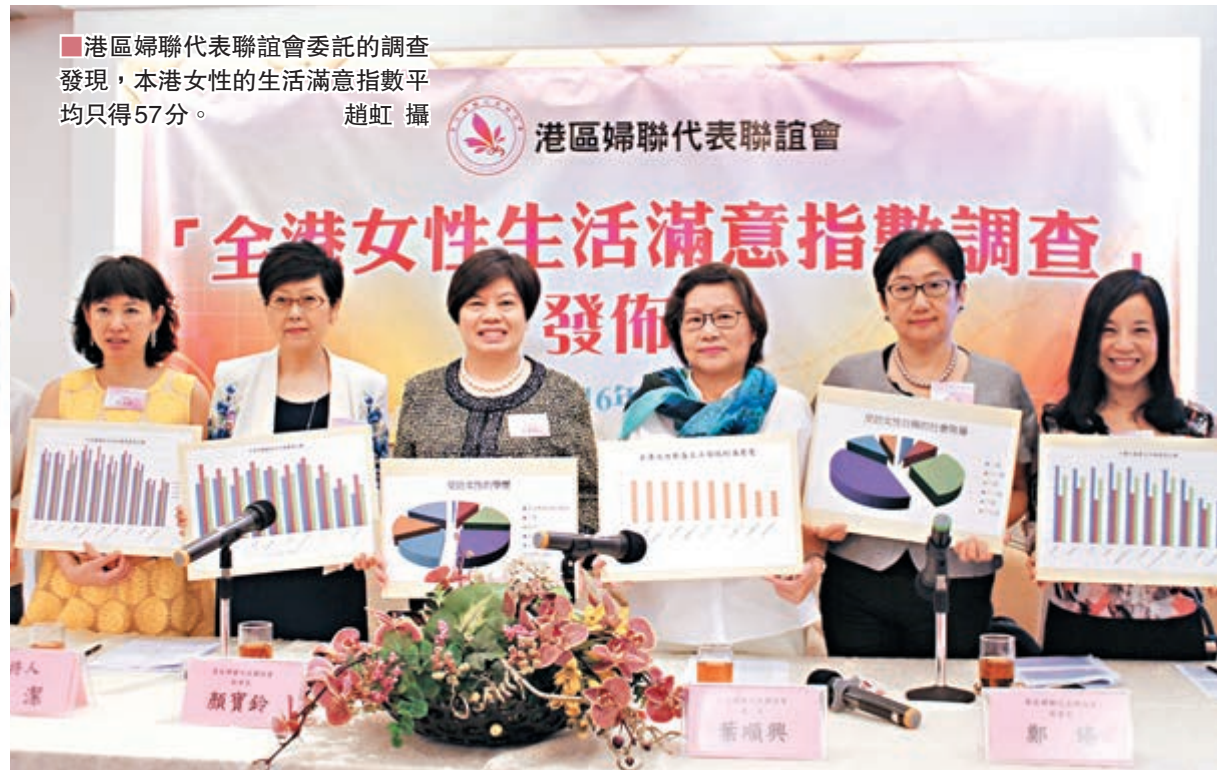
港區婦聯代表聯誼會委託的調查發現，本港女性的生活滿意指數平均只得57分。