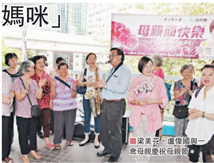
梁美芬、盧偉國與一眾母親慶祝母親節。

此外，她前日也發佈了一段名為《兩個媽媽的故事》的一分半鐘短片。片中以蒙太奇的方式，講述作為律師和立法會議員的母親梁美芬和另一位全職媽媽的小故事。雖然兩位母親一個投身於工作，另一個致力於家庭，但她們同樣深愛家人。短片最後打出「沒有什麼比你更重要」字樣，發出對全港媽媽的祝福，感人而溫馨。