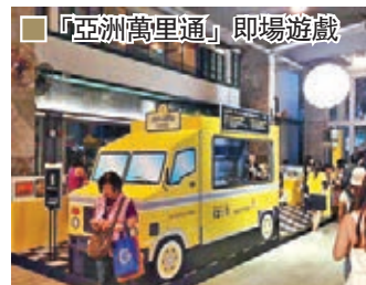
場內參加遊戲的本地創意產品

有得食之餘，你還可參加「Move for Miles」即場遊戲，賺取高達3,300「亞洲萬里通」里數，於活動期間到「亞洲萬里通」會員專區登記可領取計步器乙個，攜計步器遊走會場，每累積10步便可獲1「亞洲萬里通」里數；每日第一位累積得3,000步的參加者則可贏取3,000里數。此外於元創方內10個「亞洲萬里通」特設 checkpoints 拍照及上載至個人 Facebook 或 Instagram，並標記 #LifeRewarded，每分享1張相可得30里數。參加者可一次上載10張於 checkpoint 拍攝的照片，以賺取最多300里數。如玩累了，會員更可於特設的會員專區休息。