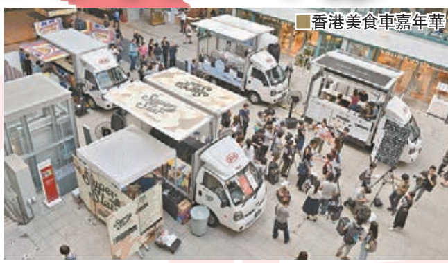
香港美食車嘉年華

這個首屆香港美食車嘉年華 (Hong Kong Food Truck Festival) 由 FEED 主辦、Cook In 呈獻的，今天由上午11時至晚上9時假中環鴨巴甸街元創方舉行，為愛吃美食的你及媽媽帶來精彩而別開生面的美食車飲食體驗。