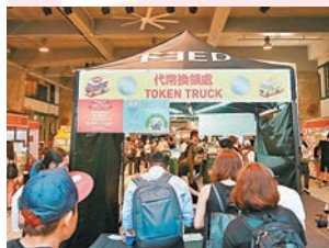
場內以代幣形式購買美食

這個首屆香港美食車嘉年華 (Hong Kong Food Truck Festival) 由 FEED 主辦、Cook In 呈獻的，今天由上午11時至晚上9時假中環鴨巴甸街元創方舉行，為愛吃美食的你及媽媽帶來精彩而別開生面的美食車飲食體驗。