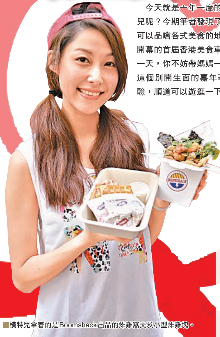
模特兒拿着的是Boomshack出品的炸雞窩夫及小型炸雞塊。

今天就是一年一度的母親節，你想帶媽媽到哪儿呢？今期筆者發現了一個既可以遊覽逛街，又可以品嚐各式美食的地方，這就是剛於星期四才開幕的首屆香港美食車嘉年華，剛好今天是最後一天，你不妨帶媽媽一嘗新意，走到元創方參加這個別開生面的嘉年華，來一個美食車飲食體驗，順道可以遊逛一下這個充滿懷舊感的歷史建築物，或許物色到一份與別不同的母親節禮物，一舉多得，令媽媽過一個不一樣的母親節。