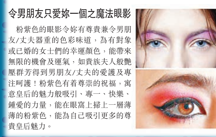
令男朋友只愛妳一個之魔法眼影

人靠衣裳，佛靠金裝，女士們貪靚愛打扮是自然本能來的，所謂先敬羅衣後敬人，其實種種都是為了吸引身邊的人。上期談了吸引男士首飾的魔法眼影妝，今次就教大家餘下的增強愛情、人緣的秘訣，揭示各種顏色眼影的魅力及分析如何令對方一見難忘。