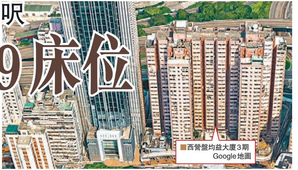
西營盤均益大廈3期 Google地圖

香港文匯報訊(記者 顏倫樂)本港地小人多,蝸居處處,就連酒店賓館亦極盡「的般」。城規會剛接到一份新申請,涉及西營盤均益大廈3期地下及閣樓4號至9號商舖,兩層樓面僅約8,162方呎,申請改裝成10個房間作酒店賓館之用,平均房間面積約412方呎。聽來似乎合理?但原來10個房間共提供69個床位,換言之,旅客的人均居住面積僅得60方呎。