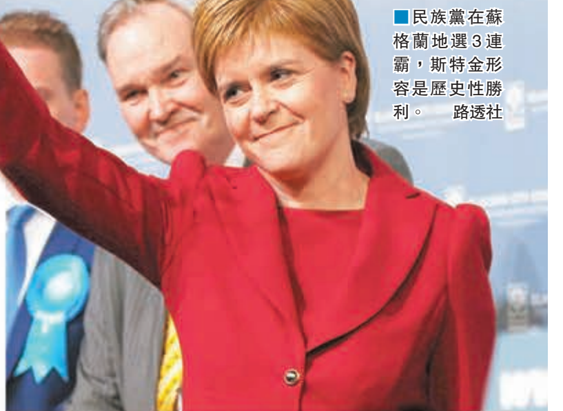
■民族黨在蘇格蘭地選3連霸，斯特金形容是歷史性勝利。

■表示工黨應集中準備2020年大選，設法奪回失落的議席，促請不滿者給科爾賓更多時間。