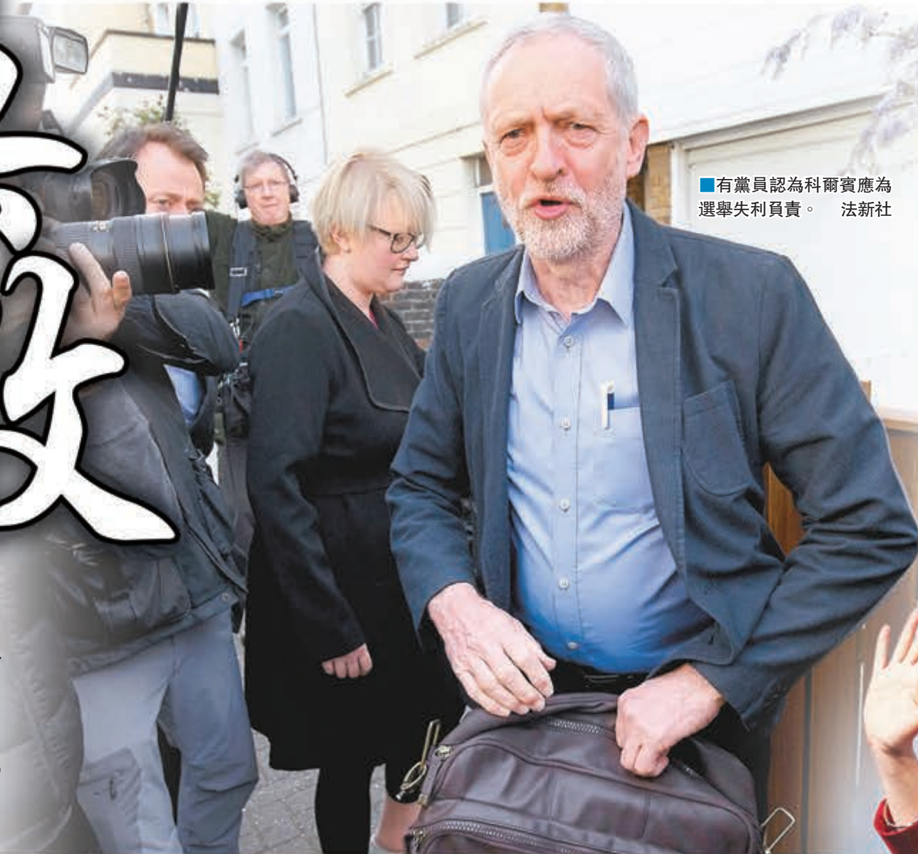
■有黨員認為科爾賓應為選舉失利負責。