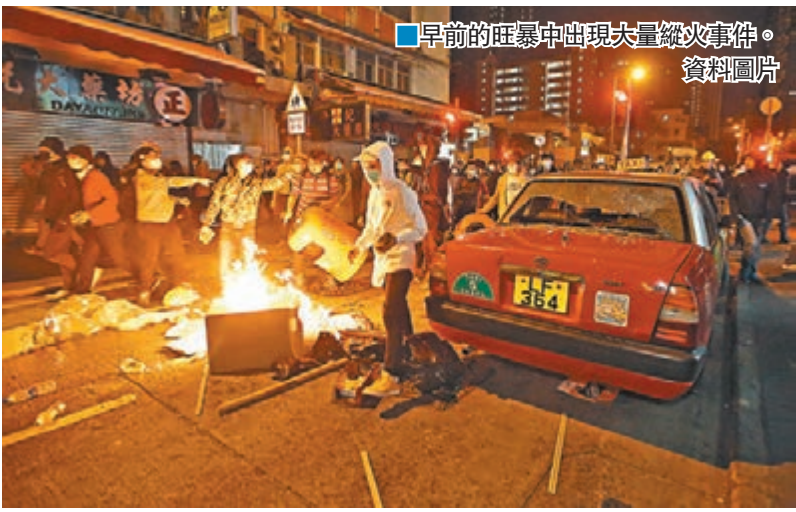
■早前的旺暴中出現大量縱火事件。