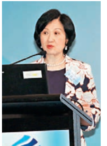
葉劉淑儀批評有人為選票把香港前途「擺上枱」。