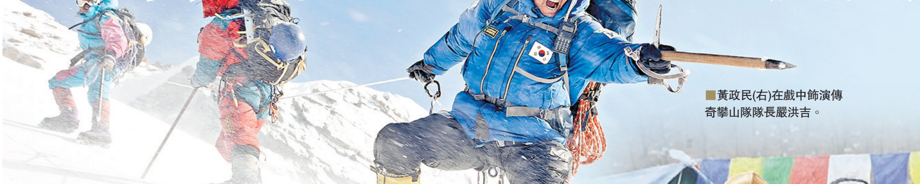
■黃政民(右)在戲中飾演傳奇攀山隊長嚴洪吉。

喜馬拉雅山，一個被喻為神的領域，凡人難以接近。韓國影帝黃政民和實力派男星鄭宇為了拍攝改編自真人真事的登山電影《喜馬拉雅：絕地救援》，早前便親赴當地取景。二人接受本報電郵專訪時說，登山雖然辛苦，但比起感受登山的險峻和筆墨難以形容的美景外，更希望觀眾感受到這是一部關於人的故事，一部講人間有情的電影。