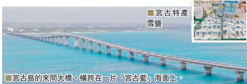
■ 宮古島的來間大橋、橫跨在一片「宮古藍」海面上。

在「潛水」完就最好去附近的德國文化村參觀，德國文化村源於1873年，德國船員在宮古島附近發生船難被島民救起，及後為紀念兩地友誼，成立上野德國文化村，建有多座城堡，其中一個城堡內設博愛紀念館，場景佈置參照昔日德國人在此居住生活的情況，也擺放了昔日航海用的物件。城堡臨海而建，高居小山腰，如果拍婚紗照相信特別漂亮。