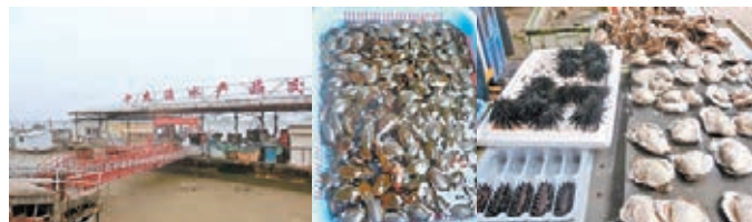
■ 南沙十九涌 ■ 十九涌海鮮品種多。

另一地點是十九涌，出海就是伶仃洋，海邊沒有海灘，只有石堤壩，一涌到十九涌是廣州的候鳥自然保護區、果菜生產基地及海鮮批發市場，南沙的特產有火龍蕉、牛奶蕉、皇帝蕉等等，海產市場是可以買海鮮如蠔子、蠔、蟹、蚌、蝦、龍蝦、海膽等；海鮮活蹦亂跳，遊客只需給予加工費就可以把自行購買的海鮮帶到周邊的酒樓加工。又可以買芒果、西瓜、香蕉、乾貨有涼果、鹹魚；但這裡消費不便宜，火龍蕉15元一斤，出名的葵雞300元一隻；因為是食葵子長大的，特別清香。