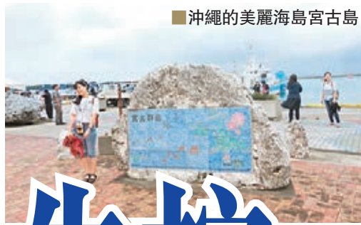
■ 沖繩的美麗海島宮古島