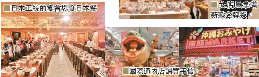
■ 日本正統的宴會場食日本餐