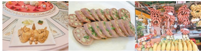
■ 南沙著名葵雞 ■ 南沙出名蓮藕 ■ 火龍蕉