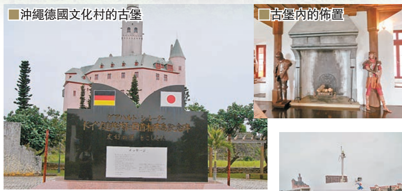
■ 沖繩德國文化村的古堡