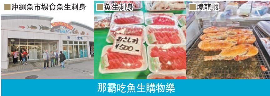
■ 沖繩魚市場食魚生刺身