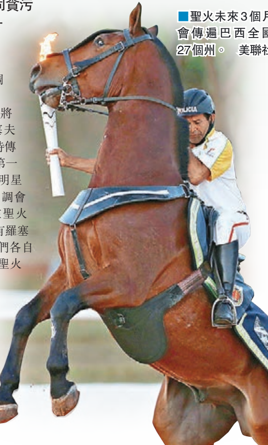
聖火未來3個月會傳遍巴西全國27個州。

本身已因為涉嫌挪用公款受查的羅塞夫，除了可能對新的調查，還可能遭到國會彈劾。巴西參議院最快下周就彈劾案表決，一旦通過，羅塞夫便要停職最多180天，接受彈劾審訊，副總統特默則會暫代總統職務。雖然特默本身亦捲入涉貪案，但雅諾表示由於證據不