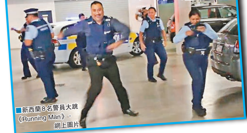
新西蘭8名警員大跳《Running Man》。