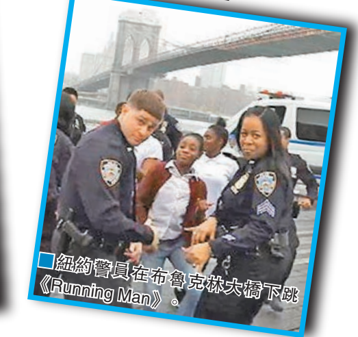
紐約警員在布魯克林大橋下跳《Running Man》。

新西蘭警方前日在社交網站facebook上載一段招募短片，片中8名警察大跳《Running Man》舞蹈，透過別開生面的方式，洗脫警察嚴肅古板的形象，希望在今年內能成功招募約400名新警員，尤其是毛利人、亞裔人、中東裔人和印度裔人等。新西蘭警方又向英國、美國和澳洲等執法部門「挑戰」，邀請他們齊跳《Running Man》，紐約警方(NYPD)已接受挑戰。