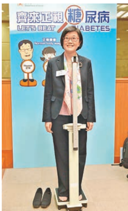
衛生署署長陳漢儀出席預防糖尿病活動，示範量度體重指標。資料圖片

互聯網：互聯網的最大優點是及時、方便、詳盡，而且可跨越地域限制，接收世界各地的公共衛生資訊。互聯網更可說是把訊息傳遞給青年人的最有效渠道。