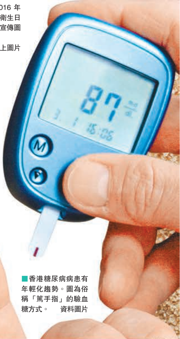
香港糖尿病病患有年輕化趨勢。圖為俗稱「篤手指」的驗血糖方式。