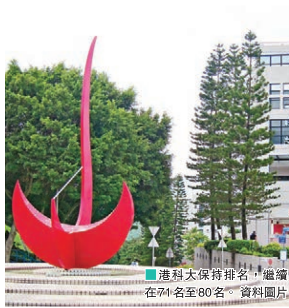
港科大保持排名,繼續在71名至80名。