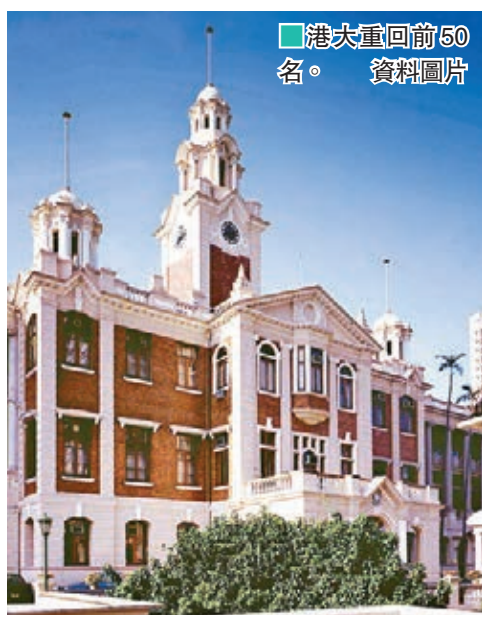
港大重回前50名。資料圖片

香港文匯報訊(記者 高鈺)英國《泰晤士高等教育》(Times Higher Education, THE)今日公佈2016年全球大學聲譽榜,其中亞洲區表現大躍進,上榜的100強大學中,共有18所來自亞洲,較去年的10所大增。而香港院校排名亦有進步,首次有3所大學同時打入頭80名。其中,香港大學重新打入首50,位列第四十五,科技大學維持於71至80組別,中文大學更由去年100位不入,急升逾20位至71至80組別。