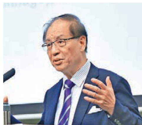
劉明康在演講中就中國經濟前景發表了看法。

香港文匯報訊(記者涂若奔)內銀近期負面消息不斷,不少分析擔憂不良貸款問題會失控,並引發金融系統的風險。中國銀監會前主席劉明康昨日在本港會見傳媒時表示,內地目前正處於去庫存、去槓桿和去過剩產能的階段,形容「這是個痛苦的過程」,相信今年內銀的不良貸款肯定將會上升,但他有信心內地不會發生大的系統性風險。