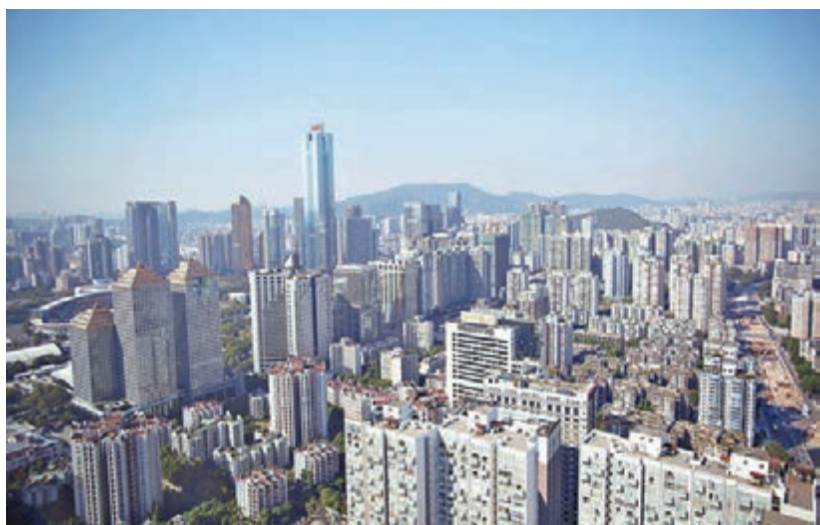
■廣州樓市成交熱度持續,「五一」小長假共推19個一手項目,而四月最後一周,該市一手網簽已達3,000套。

香港文匯報訊(記者古寧、李昌鴻 廣州、深圳報道)剛過去的「五一」假期,廣州與深圳樓市走勢迥異:廣州「五一」小長假推出19個一手項目,而深圳同期只推出一個新盤。在四月最後一周,廣州一手網簽已達到3,000套,而深圳一、二手成交合計才2,219套。