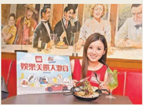
源源獎賞。由即日起至6月3日期間，商場與加德士攜手推出「娛樂美饌大激賞」活動，讓大家在邊消費的同時，享受商場各種娛樂體驗，可免費享用各式佳餚美食。泊車及消費滿指定金額更可獲贈 HK$100 加德士 StarCard 咭；而加德士會員咭更可享額外優惠，讓大家盡情享受吃買玩樂的多重樂趣。

貴為東九龍娛樂美食最紅點，MegaBox 設有全港首間 UA IMAX 戲院、全港最大海景溜冰場及 CEO，去年更引入了香港室內高爾夫球訓練場 GreenLive 旗艦店，可謂東九龍區吃買玩樂一站式娛樂最紅點。此外，商場更擁有多達40間環球美食食肆，菜式種類中、西兼備，包括美、日、韓、泰、越等，更有特色食肆，環球美食共冶一爐。而加德士再賞咭，讓你以優惠價錢享用優質燃油，更一路盡享