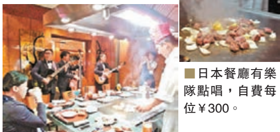
日本餐廳有樂隊點唱，自費每位¥300。

大家應有概念坐郵輪去旅行有別於你去報旅行社團，陸地旅行社是全程為你規劃好行程、景點，而郵輪主要供應你住吃娛樂，岸上活動基本上郵輪只是一個中間人，提供你一些岸上遊的線路建議(是當地旅行社設計的)，你可跟隨自己喜好選擇，你甚至所有日子都留在船上不去其他地方消費也沒問題，只是你可能嫌悶都會上岸玩。也就是說郵輪正朝着移動的大型度假村消費娛樂場方向走，就似一間五星級酒店，內裡提供很多娛樂場所，多種餐廳選擇，收費合理，例如有日本燒師傅當場煮食表演，收費300元人民幣，甲板上食日式火鍋，收費百多元；有露天酒吧，卡拉OK房供你消遣，你不用四處找夜店省卻交通費，醉了不用擔心，很輕易回房間睡眠；你可以不全自費，食團費包了每天5餐免費餐，早餐、午餐、下午茶、晚餐和宵夜，事實上坐郵輪度假的人心態亦需要改變，追求不是去多少地方和多少景點，而是你同家人親朋好友去玩，一齊吃喝玩樂，聊天放鬆就可以了。問了兩家印度家庭，他們說來郵輪遊，主要一班小孩可以團聚一齊游泳、打遊戲機，他們感覺郵輪上很有家庭Feel，很溫暖。所以來此慶祝母親節、父親節、家庭節日都不失為好方法，由香港或南沙出發、7天6晚的日本航程由4月中至9月，為期五個月。