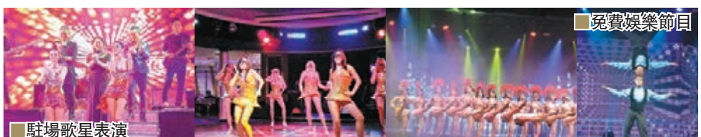
免費娛樂節目 唱歌表演節目多

以麗星郵輪旗艦「處女星號」於香港、廣州南沙聯合母港的首個日本航線為例，行程是：第一天於香港登船，第二天郵輪抵達廣州南沙，將安排岸上觀光行程，廣東客人從南沙登船，第三天公海航行，第四天下午郵輪抵達日本沖繩那霸，將安排岸上觀光行程，第五天郵輪抵達日本沖繩宮古島，將安排岸上觀光行程，第六天公海航行(回程)，第七天郵輪抵達廣州南沙，第八天上午抵港。岸上遊在明天愛漫遊版講，在這裡先講船上的活動。來自雲頂集團的麗星旗下擁有六艘郵輪，包括「處女星號」、「雙子、寶瓶、天秤、雙魚及「大班」。作為麗星郵輪旗艦「處女星號」設有13層，建有935間客房，備有海景客房及套房等選擇。餐飲選擇豐富，包括國際自助餐、中菜、西餐、日本菜、馬來西亞美食等；消閒娛樂設施多元化，如各類按摩服務、健身室、蒸氣室、髮型屋、樓高兩層的歌劇院、大型免稅店、迷你高爾夫場及兒童活動中心等，亦有最漂亮的露天泳池，100米巨型滑水梯和豪華大堂是他們的標誌。