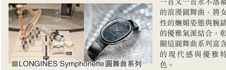
LONGINES Symphonette 圓舞曲系列

用色方面，作者則採用品牌的主色深藍色，以及酒紅色作為主色調，帶出高雅、神秘與浪漫感覺。Symphonette 腕錶伴隨著畫中舞者婀娜多姿的身影於月夜下、華麗舞會中和水晶球內翻翩起舞，演繹一首又一首永不落幕的浪漫圓舞曲，將女性的嫵媚姿態與腕錶的優雅氣派結合，彰顯這圓舞曲系列富含的現代感與優雅特色。