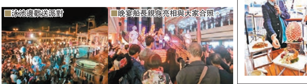
泳池戲水派對 晚宴船長親身亮相與大家合照

因為有些日子全天下海上航行，你就要享受船上為你設計的收費或免費活動，例如做運動、睇戲、睇表演，做手工藝，甲板上睇風景，如果你是海景房，床架設計特別高，在床上也望到海，身在水面上，有身心舒暢之感；有些房間還有大電視，可收到很多台，電影、電視劇任睇，在船上可補回不少未睇過的港片哩。怕客人悶，船上有教跳社交舞、健身舞、肚皮舞老師 Olga、瑜伽、剪紙、紙娃娃製作、熊貓、氣球折疊、美妝示範等活動；事實處女星上的千三工作人員都十八般武藝俱全，除了本職，還會表演或教跳舞，以及兼任教做手工藝的導師。