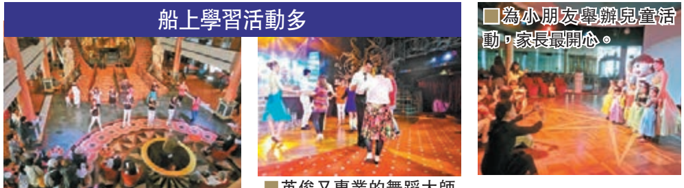
船上學習活動多 為客人設計的互動學跳舞節目

為迎合亞洲人及中國內地人的口味，「處女星號」的設施節目較初期的設計改變了許多，重視了成熟客人的口味，唱歌表演節目特別多，香港、台灣紅歌星如任賢齊、許志安等也上去表演。在大堂甲板，銀河星夜總會每天有歌手、樂隊 santing trio soundclippers 組合和紫台炫舞舞蹈員駐場表演，他們英文、中文歌都會唱；船上的駐場表演樂隊來自馬來西亞的兩男一女的主唱，歌唱得不錯，鬼馬懂得搞氣氛，大受大媽歡迎。晚上可免費聽歌，最好你叫杯飲品幫襯一下，等班服務員姐姐好交代。銀河星夜總會沒有色情，只有免費聽歌和成人想贏錢玩兩手的遊戲，特別多捧場客。歌劇院也排了不少節目，每晚也有兩三場，例如國際魔術大師 VINCENT VIGNAUD—幻想、近景魔術互動、1001夜、麗星大型表演、熱力燃燒、金色誘惑(¥388/¥280)，當然有免費和收費，看你自己選擇。