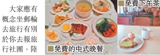
免費下午茶 免費的中式晚餐

大家應有概念坐郵輪去旅行有別於你去報旅行社團，陸地旅行社是全程為你規劃好行程、景點，而郵輪主要供應你住吃娛樂，岸上活動基本上郵輪只是一個中間人，提供你一些岸上遊的線路建議(是當地旅行社設計的)，你可跟隨自己喜好選擇，你甚至所有日子都留在船上不去其他地方消費也沒問題，只是你可能嫌悶都會上岸玩。也就是說郵輪正朝着移動的大型度假村消費娛樂場方向走，就似一間五星級酒店，內裡提供很多娛樂場所，多種餐廳選擇，收費合理，例如有日本燒師傅當場煮食表演，收費300元人民幣，甲板上食日式火鍋，收費百多元；有露天酒吧，卡拉OK房供你消遣，你不用四處找夜店省卻交通費，醉了不用擔心，很輕易回房間睡眠；你可以不全自費，食團費包了每天5餐免費餐，早餐、午餐、下午茶、晚餐和宵夜，事實上坐郵輪度假的人心態亦需要改變，追求不是去多少地方和多少景點，而是你同家人親朋好友去玩，一齊吃喝玩樂，聊天放鬆就可以了。問了兩家印度家庭，他們說來郵輪遊，主要一班小孩可以團聚一齊游泳、打遊戲機，他們感覺郵輪上很有家庭Feel，很溫暖。所以來此慶祝母親節、父親節、家庭節日都不失為好方法，由香港或南沙出發、7天6晚的日本航程由4月中至9月，為期五個月。