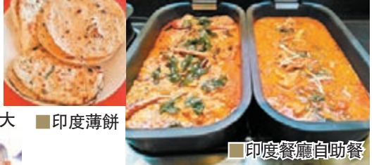
印度薄餅 印度餐廳自助餐