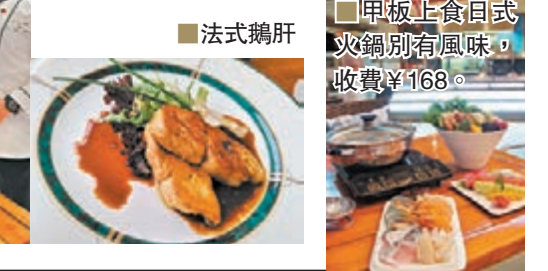
法式鵝肝 甲板上食日式火鍋別有風味，收費¥168。