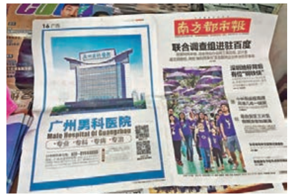
廣州男科醫院在昨日的《南方都市報》刊登整版廣告。

據鳳凰網報道，「莆田系」是對福建莆田籍人士掌握的以遊醫起家的系列醫療企業的稱稱。這些醫院以男科、婦科、不孕不育、整形等專科民營醫院起家，大量投放廣告，將醫生包裝為北京等大醫院教授、專家，多使用誇大病情、推薦新藥等伎倆騙取患者。「莆田系」還與經營困難的醫院勾結，承包科室。