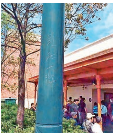
遊客在迪士尼小鎮的柱子上刻上「到此一遊」。

據介紹，香草園坐落在G-PARK的南面，右鄰「奕歐來」上海購物村，佔地面積30萬平方米，為狹長形的主題種植公園。園內設有「薰衣草園」、「七彩花田」、「模紋園藝」等景點，以及「香草集市」、「香草小街」等購物區域。園內種植了近20萬株薰衣草。目前，香草園的開放區域僅局限於大門進入後的一大片花海。