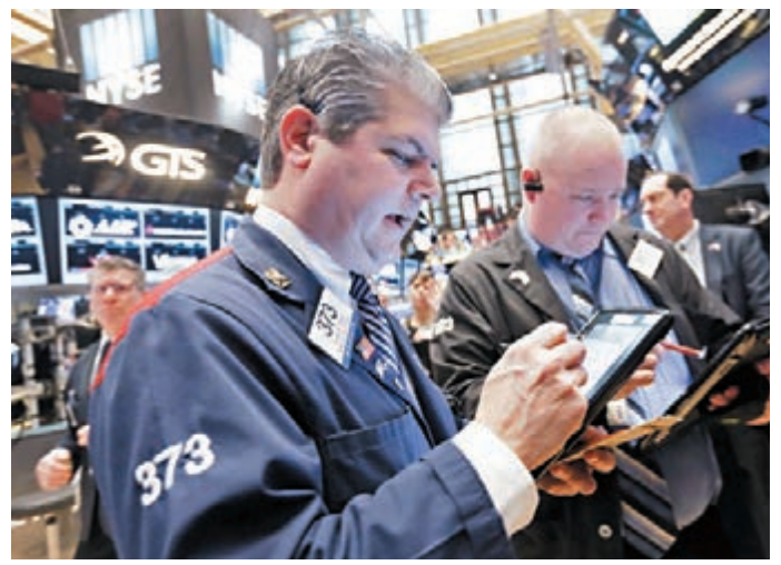
■美股上週調整，基於企業業績普遍優於預期，富蘭克林證券投顧建議投資者逢低佈局美股。

美國第一季GDP按年增長0.5%，為兩年來最慢增速，核心個人消費支出物價指數上升2.1%，高於預期。在已公佈的首季財報的287家標普500企業中，有74.2%公佈季報優於預期(去年首季67.7%優於預期)，搭配美元貶值及油價上漲提高企業盈利，短期因標普累積升幅大而震盪回調，展望美國經濟溫和增長有助支撐美股維持向好勢頭，建議逢回調之際，採取分批佈局美股。