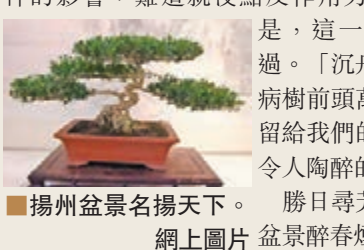
揚州盆景名揚天下。勝日尋芳度西湖，揚州園上圖片 盆景醉春煙！