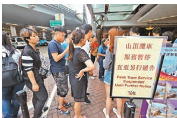
中環纜車總站外貼出通告，提醒市民纜車暫停服務。