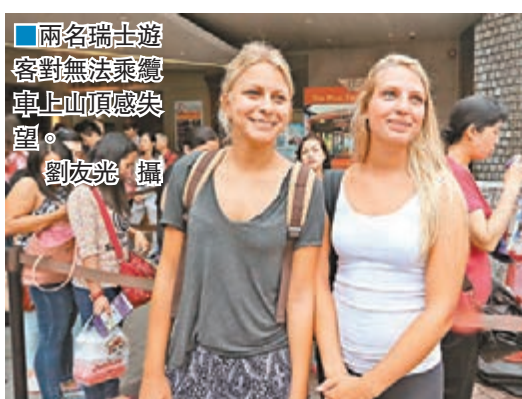
兩名瑞士遊客對無法乘纜車上山頂感失望。