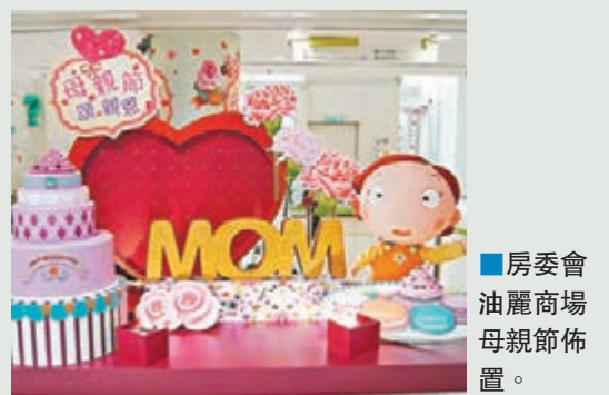
房委會油麗商場母親節佈置。

香港文匯報訊（記者 文森）母親節快將來臨，房委會指將在轄下多個商場舉辦歌頌母愛推廣活動，亦藉此增加商場人流，房委會稱，母親節當日（5月8日），居民如欲對母親表達心意，可前往房委會轄下的坪石、梨木樹、美田、天恩、晴朗、彩德和油麗商場填上及掛上心意卡，更可帶同母親及一家大小前往欣賞完成作品。