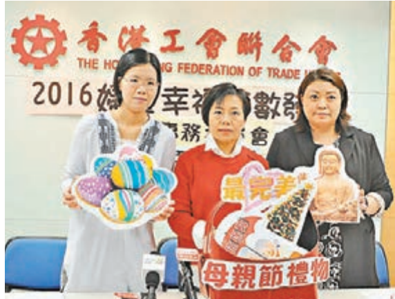
工聯會公佈婦女幸福指數調查，顯示婦女幸福感下降。

貴」（65.6%），「退休生活無保障」（50.6%）及「自己或家人太長時間工作，少見面」（35.9%）。