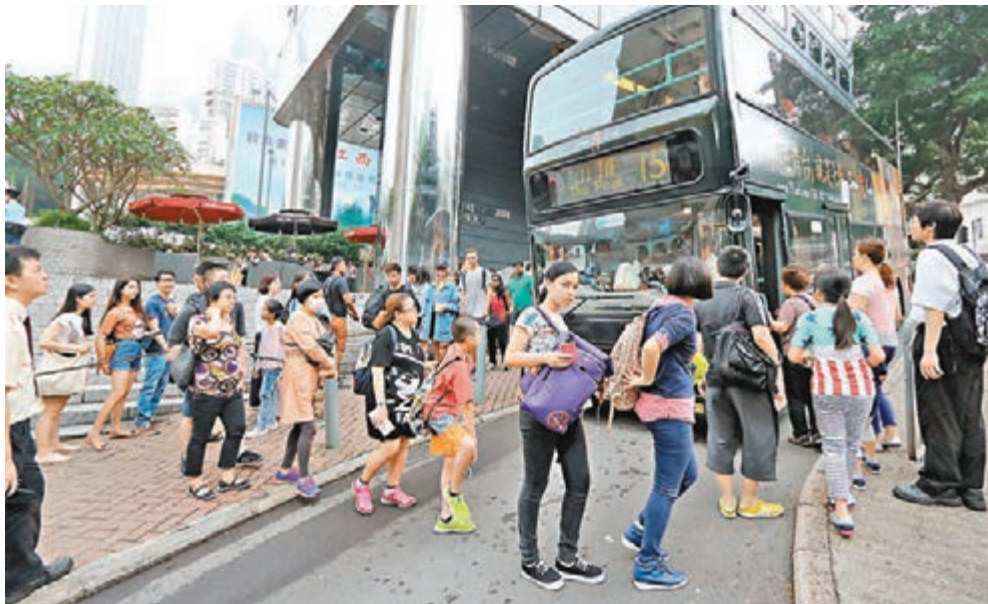
山頂纜車故障，市民排隊轉搭巴士上山頂。

有來自瑞士遊客對纜車故障要轉乘巴士上山頂感失望，不過，他希望回程下山時纜車維修妥當，讓他可乘纜車下山。