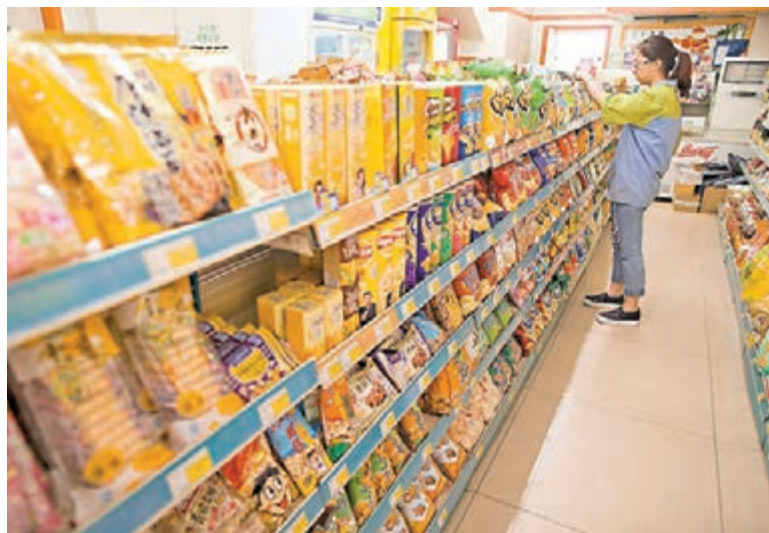
■內地4月非製造業商務活動指數為53.5%,環比下降0.3個百分點。圖為山西太原超市員工在整理貨架。

中國物流信息中心專家武威認為,4月份中國商務活動指數雖較上月小幅回調0.3個百分點,但指數仍運行在53%以上的穩健區間,意味著非製造業經濟延續穩定運行態勢。