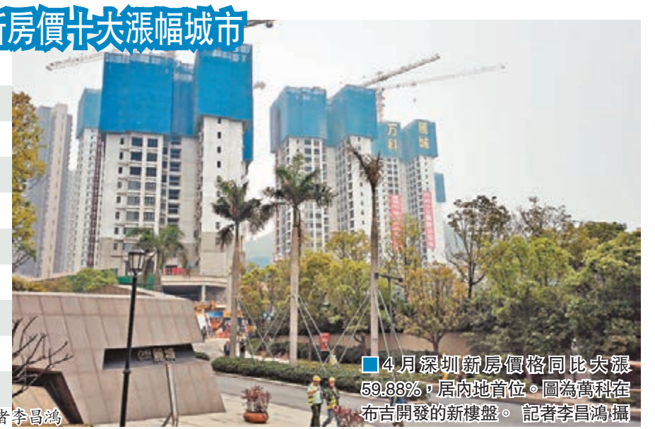
■4月深圳新房價格同比大漲59.88%,居內地首位。圖為龍崗區布吉開發的新樓盤。