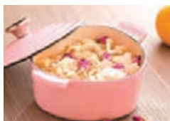
玫瑰花雪梨雪耳薏米露

今個母親節，子女可利用迷你鑄鐵鍋自製粉紅甜蜜晚餐與媽媽搭枱，製作玫瑰花雪梨雪耳薏米露和紅菜頭櫻花蝦小魚麥粉紅飯等。紅菜頭和玫瑰花營養豐富，加上為菜式點綴上一點點溫馨的粉紅色彩。這 Chiffon Pink 系列將由 5 月 3 日起公開發售。