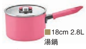
18cm 2.8L 湯鍋

想趁這個溫馨的節日聊表孝心，以答謝母親無微不至的愛護，美亞廚具推出一套三件的美亞日系 Lady Pink 廚具系列。迷人的粉紅實輕巧可愛，別具日本風格；蓋面採用平面強化玻璃設計，煮食一目了然；設計小巧的頂部摺疊把手，讓鍋具變得易於收藏。