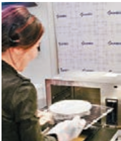
Isadora 示範煮芝士三文魚焗有機大蘑菇