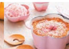
紅菜頭櫻花蝦小魚麥粉紅飯