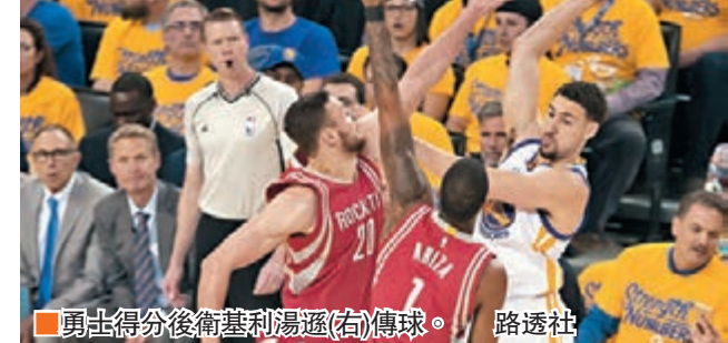
勇士得分後衛基利湯遜(右)傳球。

金州勇士昨天NBA季後賽在拿到27分的基利湯遜帶領下，主場以114：81大勝火箭，總場數贏4：1晉級西岸4強。黃蜂作客以90：88險勝邁阿密熱火，拓荒者則以108：98擊敗洛杉磯快艇隊，贏波後雙雙領先總場數3：2，距晉級只差一勝。