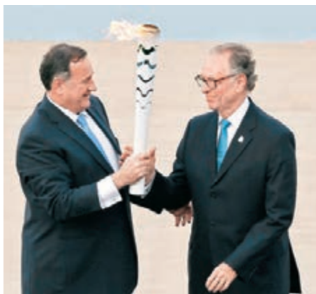
努茲曼(右)接收奧運聖火。