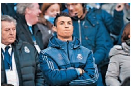
C朗隨時連次回合都要缺陣？

皇家馬德里得分主力C·朗拿度從上周開始出現肌肉疲勞，缺席了一場西甲足球聯賽後，周中再避戰了4強首回合的歐聯賽事。據《阿斯報》等多家西班牙媒體昨天透露，C朗是大腿肌肉撕裂，很可能也要錯過下周中次回合主場再鬥曼城的歐聯大戰。有指，C朗已決定接受幹細胞療法，加速傷癒以趕及在對陣曼城時復出。