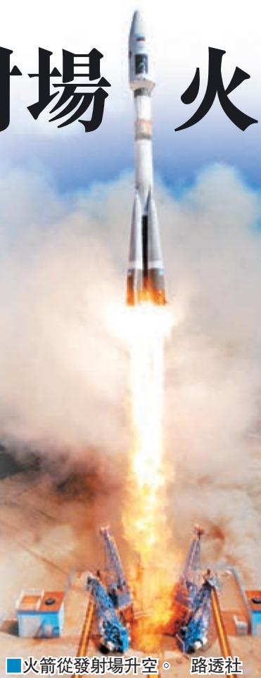
火箭從發射場升空。

俄國興建東方發射場，是為減少依賴哈薩克斯坦的拜科努爾發射場。普京早前稱，東方發射場代表着俄國航天發展的未來，俄國將在航天領域與其他國家緊密合作。 ■法新社/美聯社