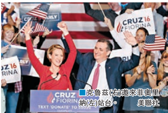
克魯茲(右)邀來菲奧里納(左)站台。

菲奧里納曾角逐今屆共和黨初選，但早於2月已退選。有共和黨人認為，克魯茲應選擇更具經驗的搭檔，但也有保守派認同克魯茲，指菲奧里納能助他與民主黨的希拉里對決。 ■《華爾街日報》/路透社