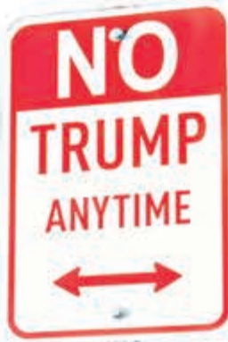
街頭藝術家設計「No Trump Anytime」(全日禁止特朗普)的路牌，豎立在加州荷里活附近。