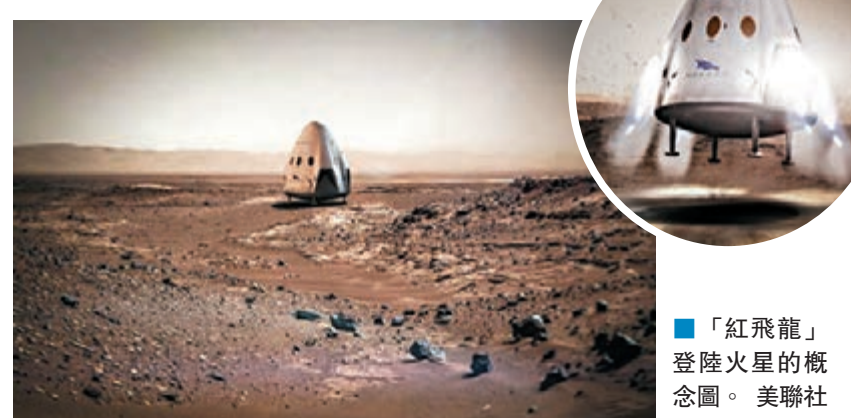
「紅飛龍」登陸火星的概念圖。

SpaceX前日獲美國空軍授予價值8,270萬美元(約6.41億港元)的合約，將於2018年5月為軍方發射一枚全球衛星定位系統(GPS)衛星，打破軍方與聯合發射聯盟(ULA)的獨家合作關係。 ■The Verge網站/法新社/彭博通訊社