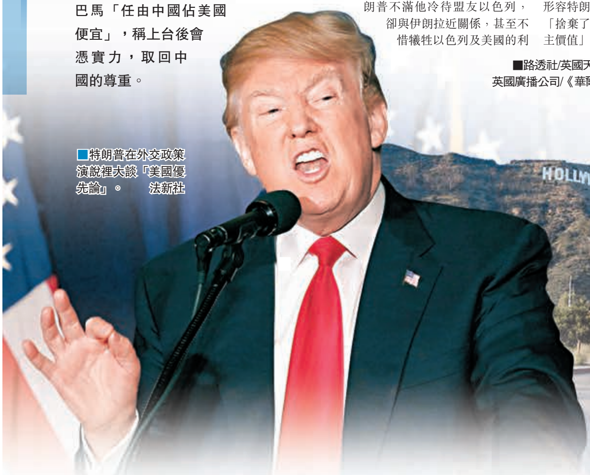
特朗普在外交政策演說裡大談「美國優先論」。