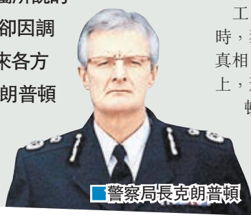
■警察局長克朗普頓

英國法庭周二裁定，1989年希斯堡慘劇96名死者是被「非法殺死」，事隔27年，蒙冤的球迷終獲平反。數千人前日在利物浦市中心的聖喬治會堂外舉行燭光悼念晚會，為死者沉冤得雪歡呼。南約克郡警察局長克朗普頓日前在電郵中指，「死者家屬所說的慘劇版本『並非真相，卻因調查而弄假成真』」，惹來各方批評。當局前日下令克朗普頓停職，希望藉此挽回公眾對警隊的信心。