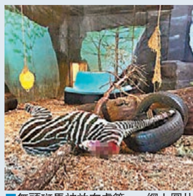
■無頭斑馬被放在虎籠。

挪威最受歡迎的克里斯蒂安桑動物園以園內斑馬過多為由，將一匹健康斑馬斬首，把血淋淋的屍體放進虎籠，作為老虎的大餐。家長狠批動物園讓遊人看見無頭屍，駭人景象令兒童心靈受創。