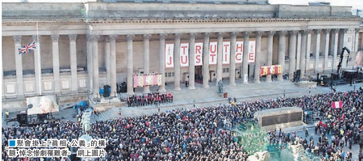
■聚會掛上「真相、公義」的橫額，悼念慘劇罹難者。

英國法庭周二裁定，1989年希斯堡慘劇96名死者是被「非法殺死」，事隔27年，蒙冤的球迷終獲平反。數千人前日在利物浦市中心的聖喬治會堂外舉行燭光悼念晚會，為死者沉冤得雪歡呼。南約克郡警察局長克朗普頓日前在電郵中指，「死者家屬所說的慘劇版本『並非真相，卻因調查而弄假成真』」，惹來各方批評。當局前日下令克朗普頓停職，希望藉此挽回公眾對警隊的信心。