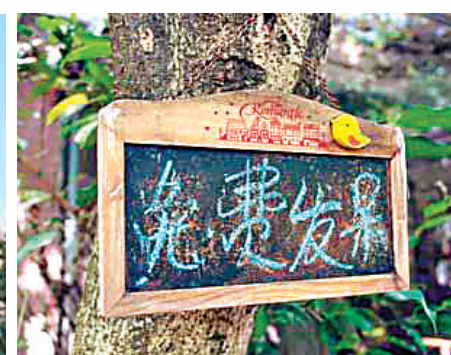
■ 園內可供人免費發呆。