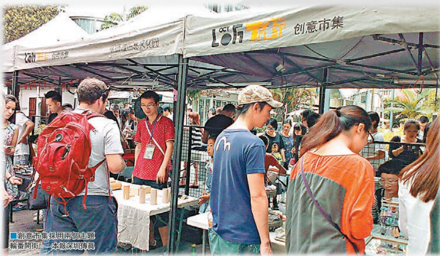
■ 創意市集採用兩個主題輪番開街。