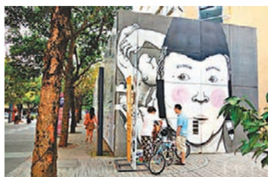
■ 牆壁上的塗鴉充滿創意。

酒窖使用回收的紅酒瓶擺成了裝飾，酒館的階梯也排滿了各國產的啤酒桶。將功能性物件用藝術包裝，設計師們對細節的錙銖必較讓生活中實用性的物件都透出設計元素，這就是這裡無處不設計的體現了。