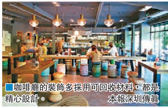
■ 咖啡廳的裝飾多採用可回收材料，都是精心設計。

地址：南山區華僑城創意園北區B2棟1樓 電話：0755-86200661 簡介：塗鴉牆壁，聯排實木書架+酒櫃，復古小電視，臉上長了油漆一樣的鐵皮壺花瓶，有些斑駁的舊煤油燭燈，每個都不一樣的碗碟，餐廳處處寫着文藝兩個字。這裡也讓文藝青年感受到自己的獨特存在。