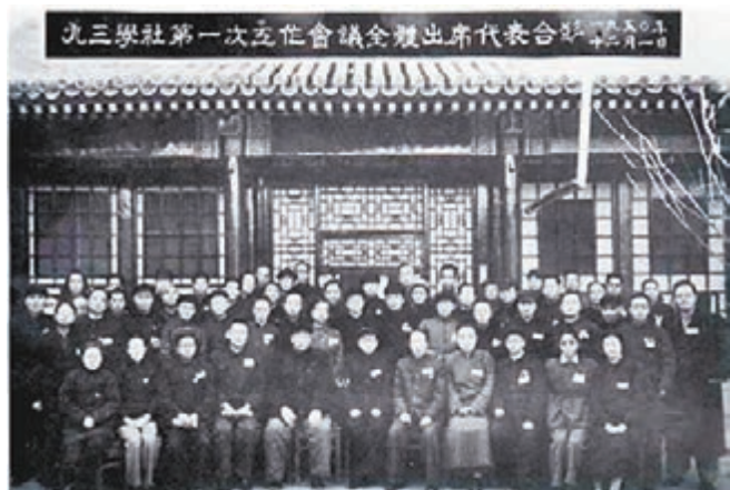
1950年12月,建國以來九三學社第一次全國工作會議。資料圖片

1945年9月3日,日本簽字投降,全國各地慶祝抗日戰爭勝利。民主科學座談會的成員也在一起慶祝,有人提出為了銘記這個具有偉大歷史意義的日子,將座談會更名為九三學社,成為永久性的政治組織,與會者一致贊同。經過一段時間的籌備,九三學社於1946年5月4日正式宣告成立。