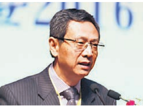
全國政協委員賈康。

香港文匯報訊(記者 聶晨靜、王曉雪 湘西報道)精準扶貧,民企怎麼扶?內地近年來風生水起的公私合作PPP模式或可提供借鑒。日前,全國政協委員、華夏新供給經濟學研究院院長賈康在「脫貧攻堅PPP湘西行」論壇上表示,PPP模式能夠形成高效率和理性的供給管理,為精準扶貧提供全套方案。賈康指出,須針對貧困地區的致貧因素對症