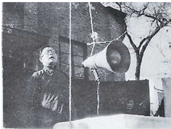
1949年2月,許德珩在北大民主廣場演講。資料圖片

毛澤東與許德珩當年同為北京大學平民教育講演團成員,過從甚密。勞君展則是毛澤東的湖南老鄉,曾在長沙讀書時共同驅逐軍閥張敬堯。1945年9月12日,毛澤東在紅岩嘴八路軍辦事處邀約許德珩、勞君展夫婦共進午餐。席間談到民主科學座談會時,毛澤東說:「既然有許多人參加,就把座談會搞成一個永久性的政治組織。」「人數不少,即使少也不要緊,你們都是些科學文教界有影響的代表人物,經常在報上發表意見和看法,不是也起到很大的宣傳作用嗎!」這番話愈加強定了許德珩組建永久性政治組織的決心。