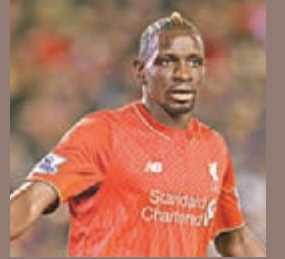
預料馬度沙高將會停賽半年。資料圖片