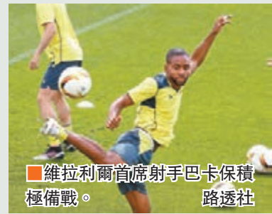
維拉利爾首席射手巴卡保積極備戰。