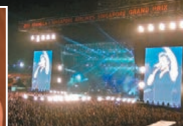
表演場地人頭湧湧