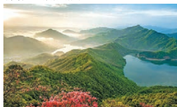
春光明媚大別山 山花映襯下的安徽省霍山縣屋脊山。