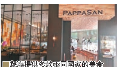
餐廳提供多款不同國家的美食