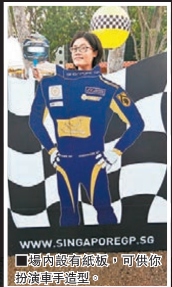
www.singaporegp.sg 場內設有紙板，可供你扮演車手造型。