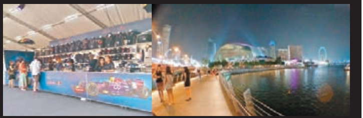
賽車紀念品可供購買