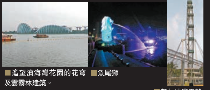
遙望濱海灣花園的花穹及雲霧林建築。