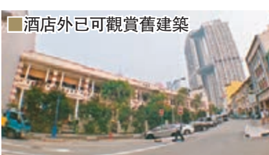
酒店外已可觀賞舊建築