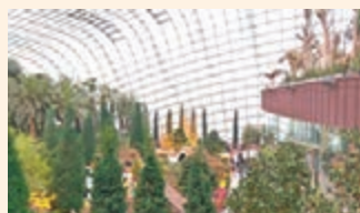
在花穹內，你可欣賞到在港看不到的花卉。