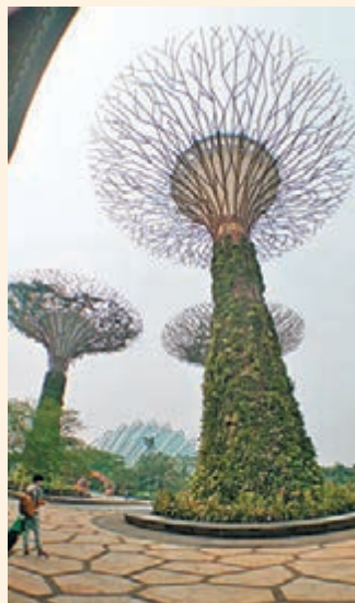
濱海灣花園到處都有這些如植物的建築物

筆者走進了這兩個冷室，的確綠意盎然，花穹複製了美國加利福尼亞州和南非的乾冷氣候，種植了32,000多株植物，其中涵蓋大約160個物種，栽培變種和品種。而涼爽的雲霧林霧氣蒙蒙，35米高的「雲山」長滿了胡姬花、蕨類植物和鳳梨科植物，全球最大的室內瀑布從雲山直瀉而下，尤其是內裡的步道頗為驚險，總之奇妙景觀不容錯過。