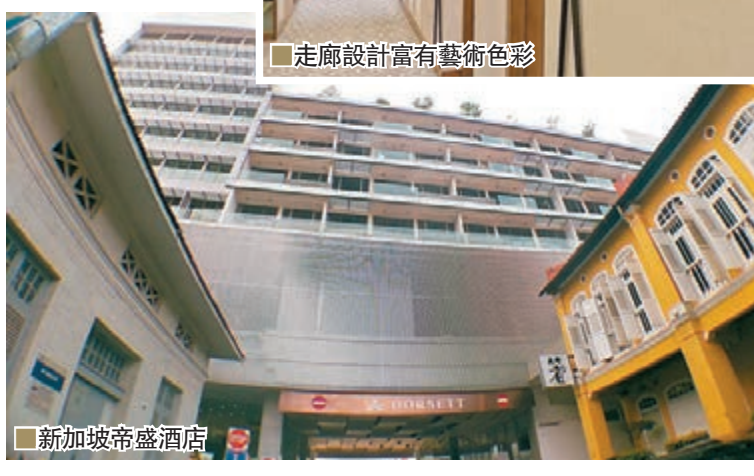
走廊設計富有藝術色彩