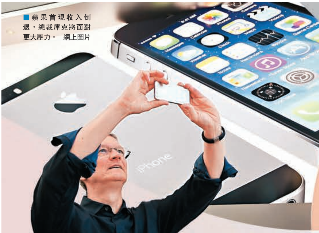
蘋果首現收入倒退，總裁庫克將面對更大壓力。