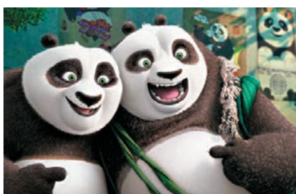
《功夫熊貓》是夢工場製作的動畫。網上圖片

夢工場近年面對強勁競爭，利潤持續下滑，去年初裁員500人，並關閉北加州的分公司，動畫產量由每年3套減為2套。有傳行政總裁卡岑貝格一直尋找買家，前年曾與日本軟體銀行及玩具生產商孩之寶洽商，最近亦與中國的潛在買家商討。同時，卡岑貝格致力開拓電