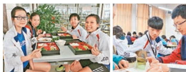
■團員與湖州五中仁皇山校區學生一起在學校飯堂共進午餐，增進交流。