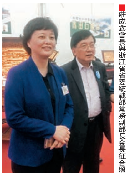
■莊成鑫會長與浙江省統戰部常務副部長金長征會照。