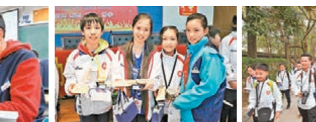
■團員（白衣）與湖州五中仁皇山校區學生進行聽課互動，體驗有趣的課堂教學。