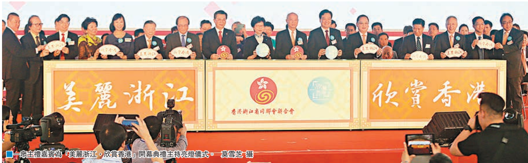
■眾主禮嘉賓為「美麗浙江·欣賞香港」開幕典禮主持亮燈儀式。

香港文匯報訊（記者 鄧學修、沈清麗）香港浙江省同鄉會聯合會主辦的全港性大型嘉年華「美麗浙江·欣賞香港」，昨日假維園4號至6號球場開幕。特區政府政務司司長林鄭月娥，中聯辦副主任林武，浙江省委常委、統戰部部長王永康出席主禮，並在籌委會主席陳仲尼陪同下巡視各展區。祖籍浙江的林鄭月娥致辭時表示，看到很多家鄉老字號食品、特色工藝品、旅遊名勝圖片等，感覺特別親切。