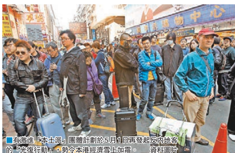
有激進「本土派」團體計劃於5月1日再發起反內地客的「光復行動」,勢令本港經濟雪上加霜。 資料圖片

香港文匯報訊(記者 尹妮)玻璃杯、反對派議員只為拉布,未有為港作出建設性工作,加上早前年初一事件影響香港形象,再遇上經濟不景氣,連帶影響旅遊業、零售業及飲食業,期望各方能理性討論及誠心合力解決問題,減少爭拗,建設更好香港。