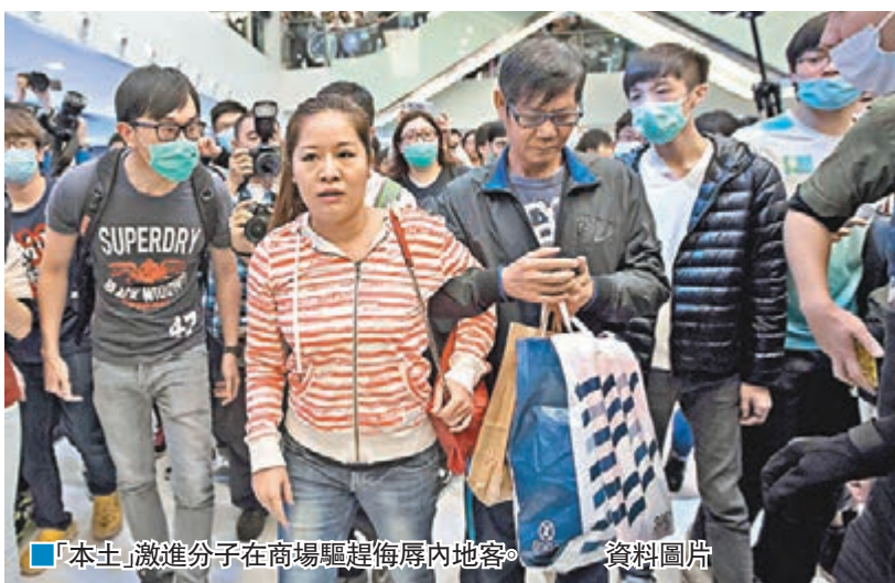
「本土」激進分子在商場驅趕侮辱內地客。