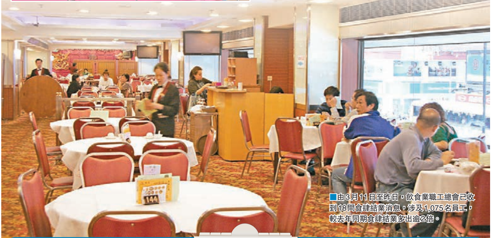
由3月11日至昨日,飲食業職工總會已收到18間食肆結業消息,涉及1,075名員工,較去年同期食肆結業多出逾2倍。