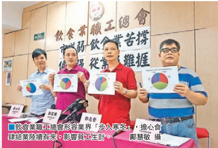
飲食業職工總會形容業界「步入寒冬」,擔心食肆結業陸續有來,影響員工生計。

適逢「五一黃金周」是內地旅客來港的黃金機會,但這些團體卻偏偏在這些日子「搞事」,實在是「趕客」行爲,一小撮人的激進行爲,最終只會嚇怕旅客,令旅遊業雪上加霜,最終受害的也只是廣大市民。 ■記者 文偉強