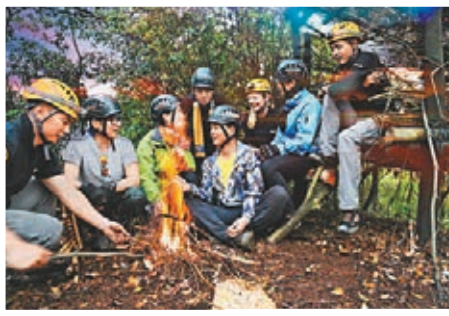
■ 荒野求生模擬真實場景的突發事件和野外求生。