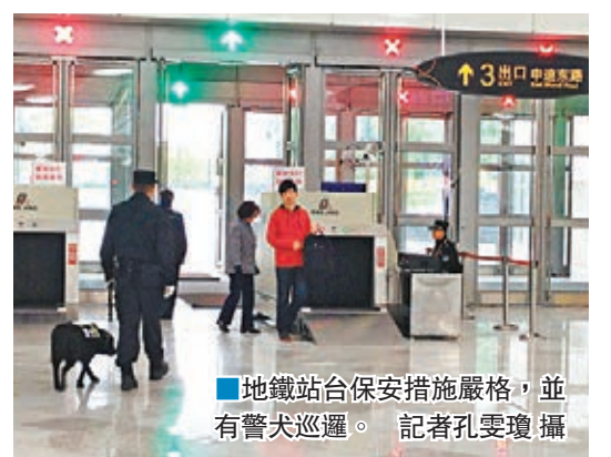
■ 地鐵站台保安措施嚴格，並有警犬巡邏。