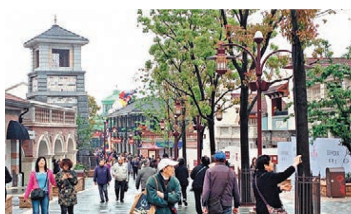
■ 上海迪士尼小鎮。

此外，小鎮非常注重細節部分，垃圾箱、廁所數量極多，大街邊上都設有流動廁所，十分照顧到遊客的方便。銀行和自動取款機也都準備就緒，可滿足遊客財務需求。小鎮還提供免費的飲用水設備，遊客只要帶上水杯就可接水飲用。