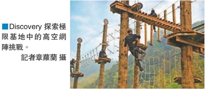
■ Discovery 探索極限基地中的高空網陣挑戰。