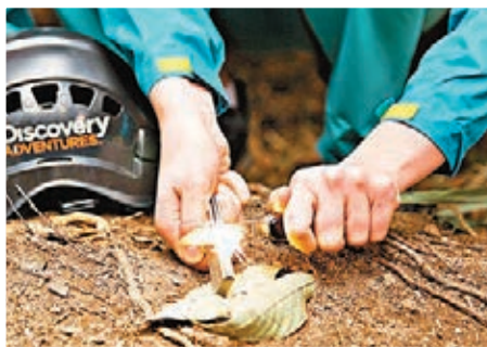
■ 荒野求生模擬極端環境下，製造求生火源。