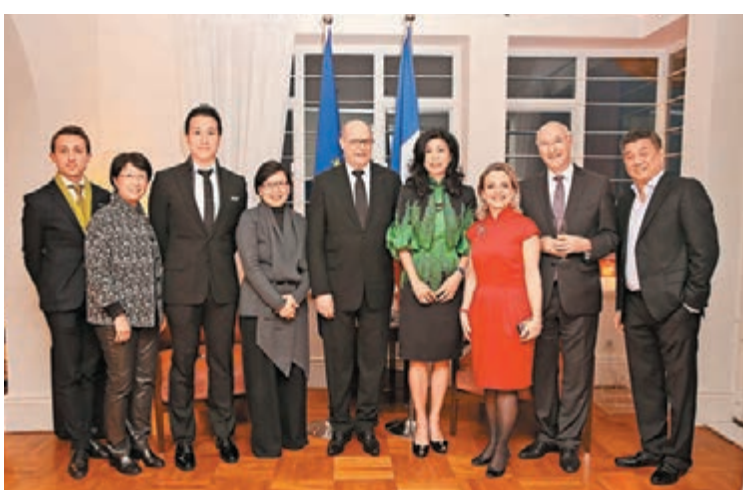
古玩展籌備小組完成八大都市巡迴宣傳後，於法駐港領事官邸召開慶祝酒會。

四月份香港春拍誕生了5件逾億元拍品，其中4件更突破2億，從成交業績來看，幾乎可以用「火爆」來形容。今年的香港國際古玩展就是在如此這般的一片欣欣鼓舞聲中即將拉開帷幕，叫人如何不興奮？叫人如何不看好呢！更何況，古玩展開展的期間，正值本港春