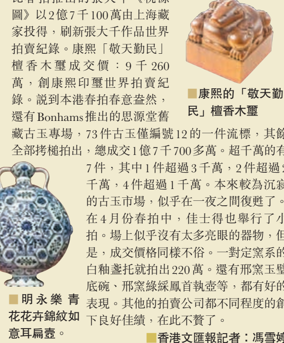
香港文匯報記者：馮雪婷

蘇富比嘉士德收藏明式傢俱小專場白手套成交，八件著地傢俱拍得逾4千300萬。蘇富比春拍推出的張大千《桃源圖》以2億7千100萬由上海藏家投得，刷新張大千作品世界拍賣紀錄。康熙「敬天勤民」檀香木壘成交價：9千260萬，創康熙印壓世界拍賣紀錄。說到本港春拍春意盎然，還有Bonhams推出的思源堂舊藏古玉專場，73件古玉僅編號12的一件流標，其餘全部搵槌拍走，總成交1億7千700多萬。超千萬的有7件，其中1件超過3千萬，2件超過2千萬，4件超過1千萬。本來較為沉寂的古玉市場，似乎在一夜之間復甦了。在4月份春拍中，佳士得也舉行了小拍。場上似乎沒有太多亮眼的器物，但是，成交價格同樣不俗。一對定窯系的白釉盞托就拍出220萬。還有邢窯玉璧碗底、邢窯綠綵鳳首執壺等，都有好的表現。其他的拍賣公司都不同程度的創下良好佳績，在此不贅了。