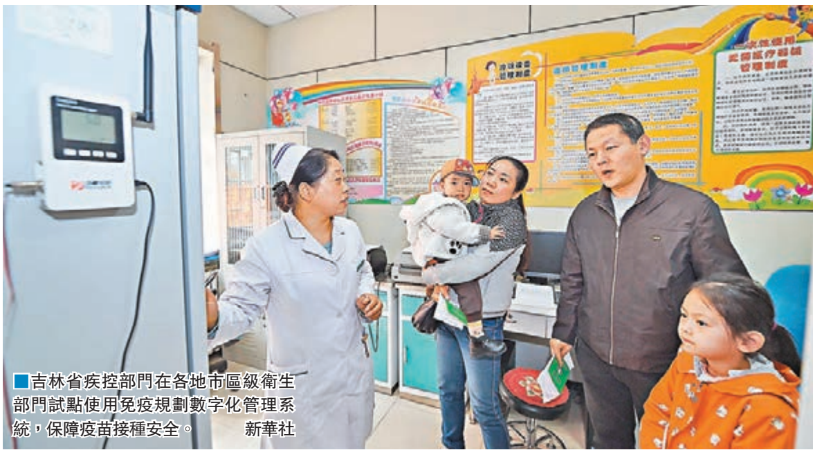
吉林省疾控部門在各地市區區衛生部門試點使用免疫規劃數字化管理系統，保障疫苗接種安全。新華社

二類疫苗流通鏈條長、牟利空間大等問題，《決定》除了《條例》原有的關於藥品批發企業經批准可經營疫苗的條款，不再允許藥品批發企業經營疫苗，將疫苗採購全部納入省級公共資源交易平台。第二類疫苗由省級疾病預防控制機構組織在平台上集中採購，由縣級疾病預防控制機構向生產企業採購後，供應給本行政區域的接種單位。此外，疾病預防控制機構、接種單位要建立真實、完整的購進、接收等記錄，做到票、賬、貨、款一致。