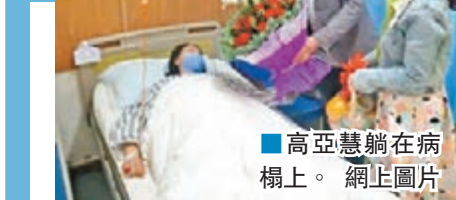
高亞慧躺在病榻上。