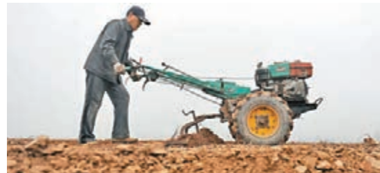
環保部指出，針對土壤污染和治理的「土十條」即將出台實施，並將啟動全國土壤污染狀況詳查。圖為山西陽泉農民在田地裡播種。資料圖片

《決定》還完善了疫苗全程追溯管理制度，規定國家建立疫苗全程追溯制度，相關企業、單位應記錄疫苗流通、使用信息，實現疫苗最小包裝單位的全程可追溯；對包裝無法識別、來源不明等情形的疫苗，要如實登記並向藥品監管部門報告，由監管部門會同衛生主管部門監督銷毀。