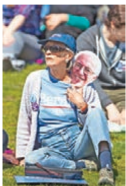
羅得島居民參加桑德斯競選活動。

今屆初選戰情異常激烈，民主黨的桑德斯為追趕希拉里「一票也不能少」，共和黨的克魯茲及卡西奇則拚盡全力，阻止特朗普提前出關。這使羅得島、特拉華州等過往被視為無關痛癢的小州重要性突然大增。