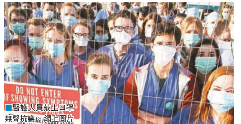
■醫護人員戴上口罩無聲抗議。

當地醫院已緊急調動護士及專科醫生當值，填補人手空缺，逾1.2萬宗非緊急手術需要取消，另有逾11萬名病人的門診預約受影響。罷工嚴重影響急症服務，當局呼籲病人除非非事非常緊急，否則應避免到急症室求診；部分預定本週分娩的孕婦，亦已被告知會推遲催生程序。