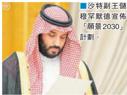
■沙特副王儲穆罕默德宣佈「願景2030」計劃。

沙特阿拉伯副王儲穆罕默德昨日宣佈「願景2030」計劃，推行全面經濟改革，期望於2020年前擺脫過度依賴石油出口的經濟結構，又會大幅增加政府支出，並成立一個總值2萬億美元(約15.5萬億港元)的主權財富基金。受消息刺激，沙特股市昨日上升2.5%，成交量創4年來最高。