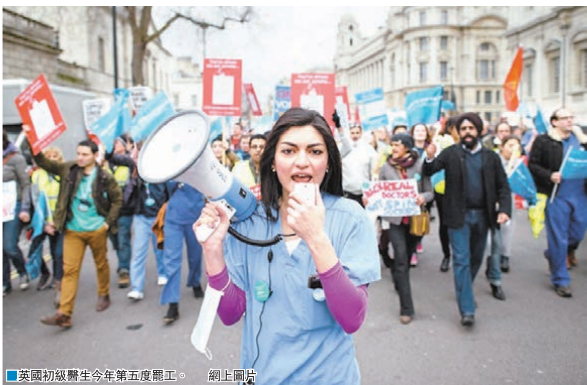
■英國初級醫生今年第五度罷工。

英國初級醫生工潮愈演愈烈，4.5萬名初級醫生為抗議政府提出的新合約條款，計劃今明兩日發起48小時罷工行動，更首次有急症室醫務人員加入，被認為是英國「國民保健服務」(NHS)設立以來首次全面罷工。擁有3.7萬名成員的英國醫學會(BMA)警告，若政府再不作出回應，不排除發動無限期罷工及集體辭職。