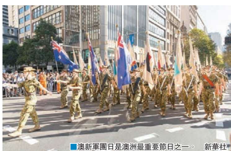
■澳新軍團日是澳洲最重要節日之一。

澳新軍團日是澳洲最重要節日之一，紀念一戰期間澳洲及新西蘭軍隊首次參與大型戰役，登陸土耳其加利波利，澳新軍團合共有1.1萬士兵陣亡。