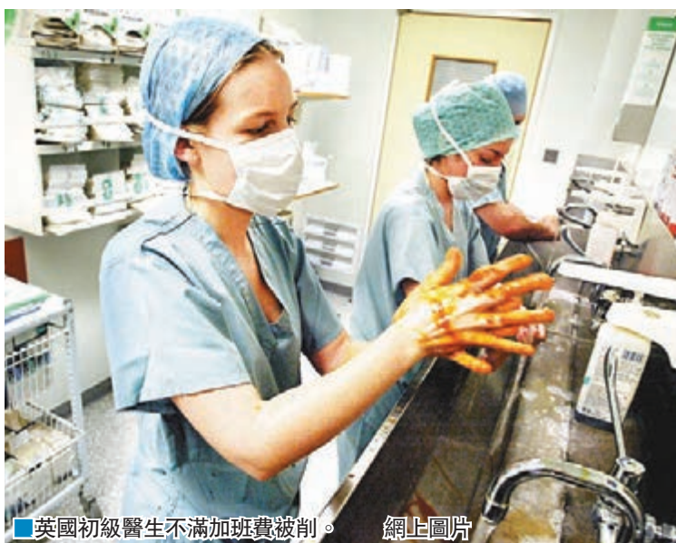
■英國初級醫生不滿加班費被削。網上圖片