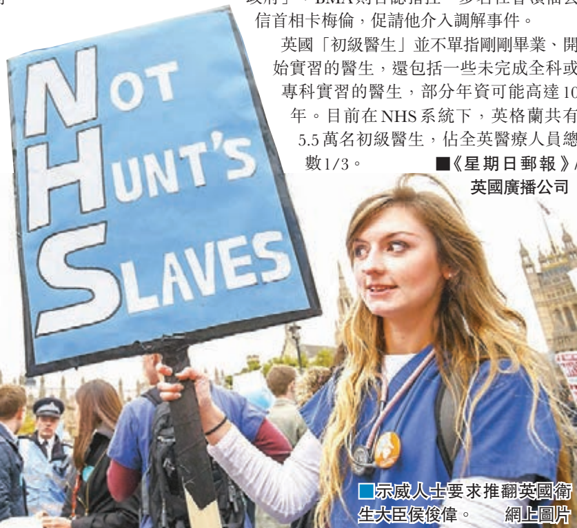
■示威人士要求推翻英國衛生大臣侯俊偉。網上圖片