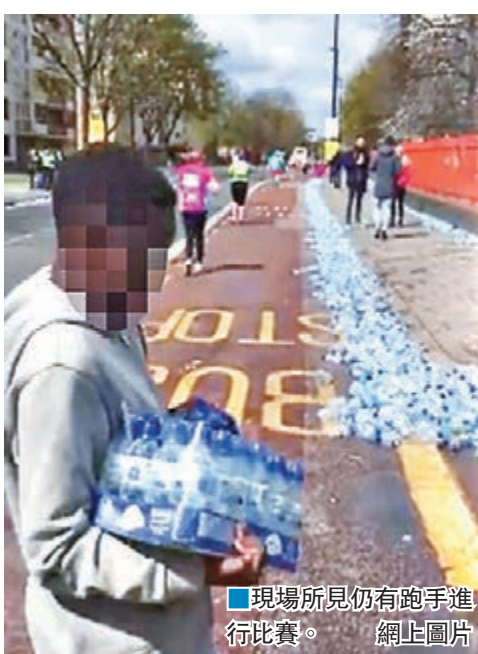
■現場所見仍有跑手進行比賽。

今次第36屆倫敦馬拉松吸引3.7萬名跑手，領先的跑手經過德特福德區約13公里處的水站，僅數分鐘後，約20名途人突然闖入水站，把一袋袋包裝好的樽裝水放入手拉車。