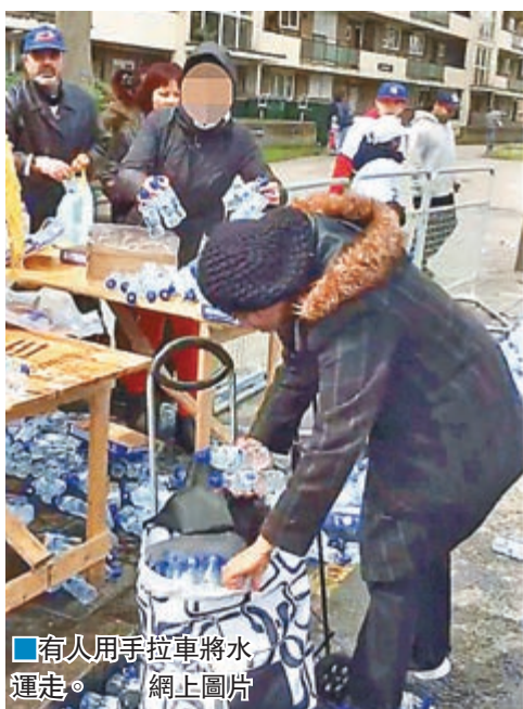
■有人用手拉車將水運走。

馬拉松本應是跑者和市民同樂的盛事，但在前日舉行的倫敦馬拉松，竟然出現令人不齒一幕。一群成人和小童趁最領先的跑手經過後，明目張膽地掠奪水站的樽裝水，更用大型垃圾袋、手拉車甚至嬰兒車運走「戰利品」，無顧其他仍在後面的跑手。