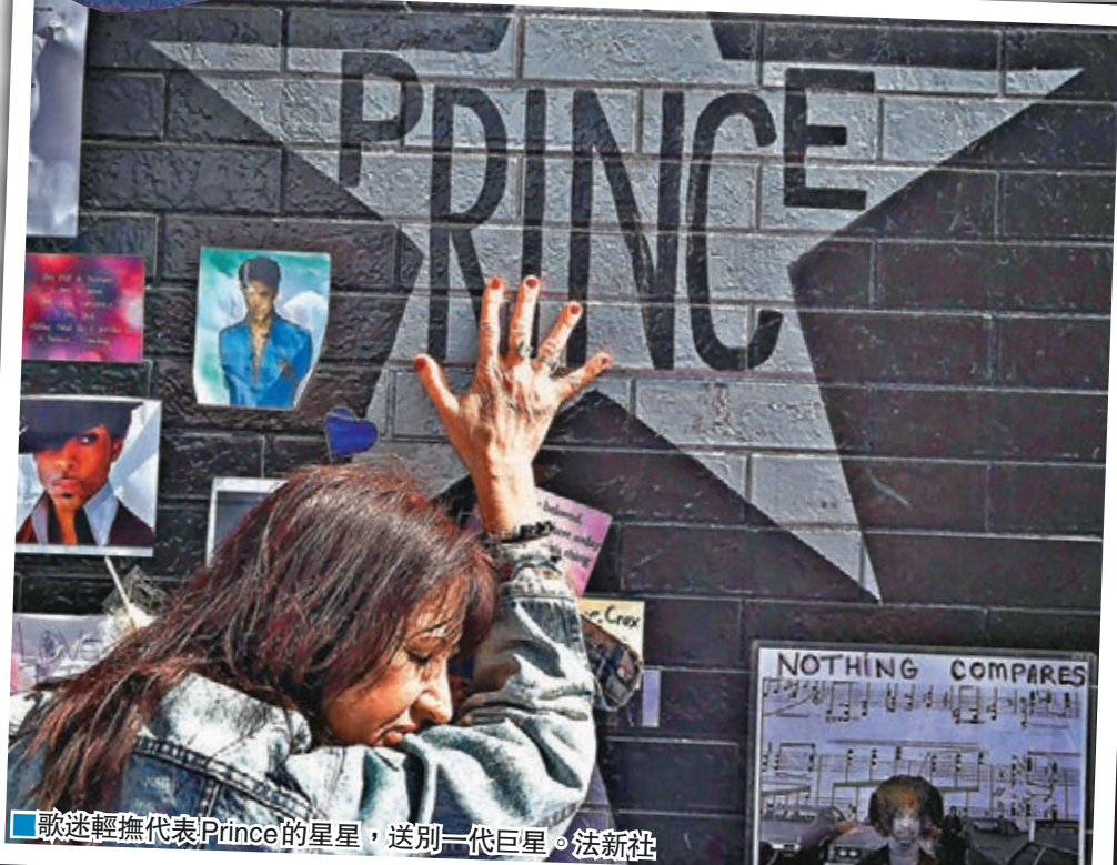
歌迷輕撫代表 Prince 的星星，送別一代巨星。