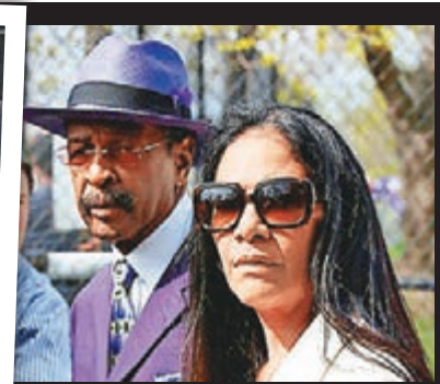
Larry Graham 及 Sheila E. 現身莊園。