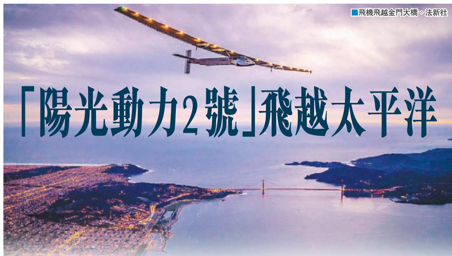
飛機飛越金門大橋。法新社

全球最大太陽能飛機「陽光動力 2 號」去年 7 月從日本飛抵美國夏威夷後，因為太陽能電池過熱受損，導致環繞地球一周的挑戰要暫時擱置。經 10 個月整修後，「陽光動力 2 號」上周四再次出發，連續飛行 56 小時後成功飛抵美國本土，完成橫越太平洋之旅，並在本港時間昨日下午降落矽谷墨菲特聯邦機場。