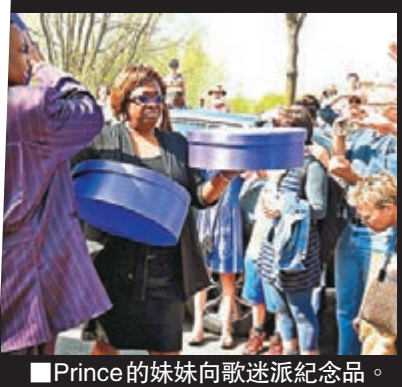
Prince 的妹妹向歌迷派紀念品。