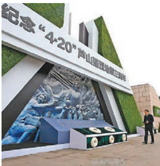
■李克強四川祭奠在蘆山地震中遇難的同胞和烈士。

截至目前，四川全省納入災後恢復重建規劃的185個地災防治項目全部開工，已完成184個。納入規劃的4,950處地質災害隱患點群防群測預警體系恢復重建、24個專業監測項目、387處地災治理、6,274戶避險搬遷、650處排危除險、20處小流域及重點場鎮綜合整治、121處損毀工程修復均全面完成。