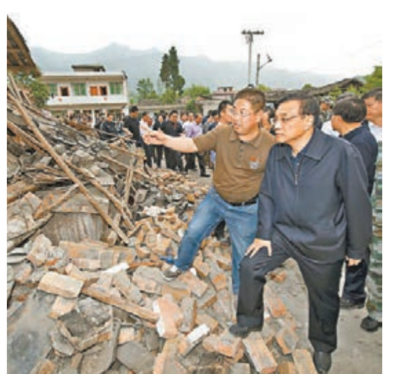
■2013年，李克強抵四川蘆山地震災區察看災情。 資料圖片