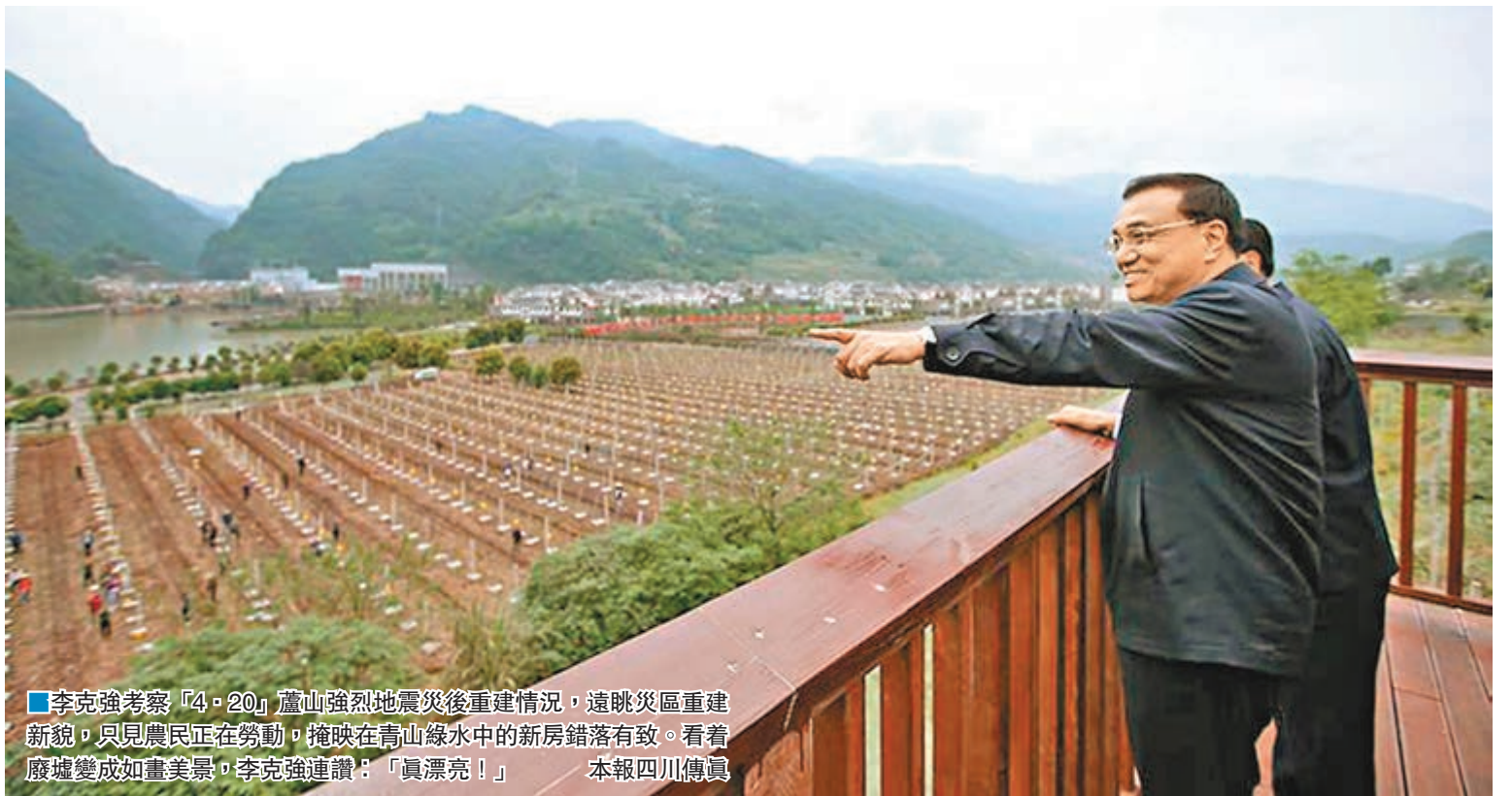
■李克強考察「4·20」蘆山強烈地震災區重建情況，遠眺災區重建新貌，只見農民正在勞動，掩映在青山綠水中的新房錯落有致。看着廢墟變成如畫美景，李克強連讚：「真漂亮！」 本報四川傳真

香港文匯報訊 綜合記者黃冬、李兵和華新網報道，國務院總理李克強昨日赴四川祭奠在蘆山地震中遇難的同胞和烈士，並對災後重建情況進行考察。四川省委書記王東明、省長尹力等陪同。蘆山震災3年後，李克強再來到「4·20」蘆山強烈地震紀念館，祭奠遇難同胞和抗震救災中英勇獻身的烈士。他緩步走上台階，俯身輕輕把一支鮮花放紀念台上。然後深深鞠躬，默哀一分鐘。現場肅穆，哀思凝重。