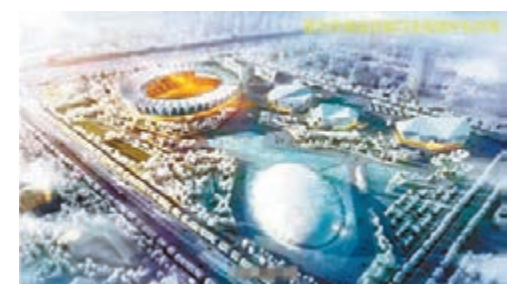
■2022年冬奧會張家口主場館效果圖。

北京市建築設計研究院有限公司相關負責人也表示，張家口奧林匹克體育中心與一般性的城市體育中心不同，將承接冬奧會、亞冬會賽事，冰上、雪上項目比較多，專業技術性要求比較高。北京市建院為此邀請了世界範圍內最具奧運會體