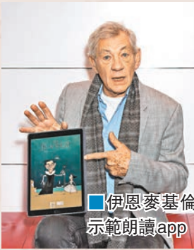
伊恩麥基倫示範朗讀app

昨日是英國大文豪莎士比亞逝世400周年紀念日，英國各地均有大型紀念活動。莎翁故鄉埃文河畔斯特拉特福的皇家莎士比亞劇院昨晚舉行紀念晚會，邀來一眾著名演員演出經典莎劇，英國王儲查爾斯更客串演出神秘角色，英國以至歐洲各地戲院均直播。倫敦的莎士比亞環球劇場亦特別在泰晤士河畔搭建大型屏幕，播放有關莎翁37套劇作的微电影。