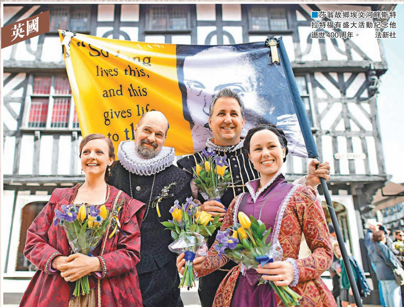
莎翁故鄉埃文河畔斯特拉特福有盛大活動紀念他逝世400周年。

昨日是英國大文豪莎士比亞逝世400周年紀念日，英國各地均有大型紀念活動。莎翁故鄉埃文河畔斯特拉特福的皇家莎士比亞劇院昨晚舉行紀念晚會，邀來一眾著名演員演出經典莎劇，英國王儲查爾斯更客串演出神秘角色，英國以至歐洲各地戲院均直播。倫敦的莎士比亞環球劇場亦特別在泰晤士河畔搭建大型屏幕，播放有關莎翁37套劇作的微电影。