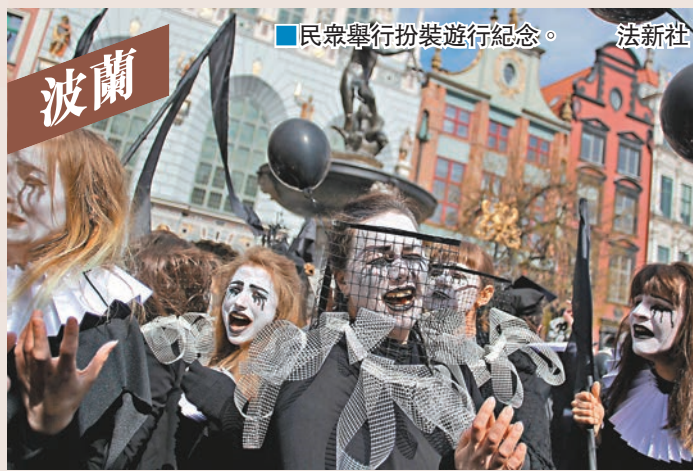
波蘭民眾舉行扮裝遊行紀念。