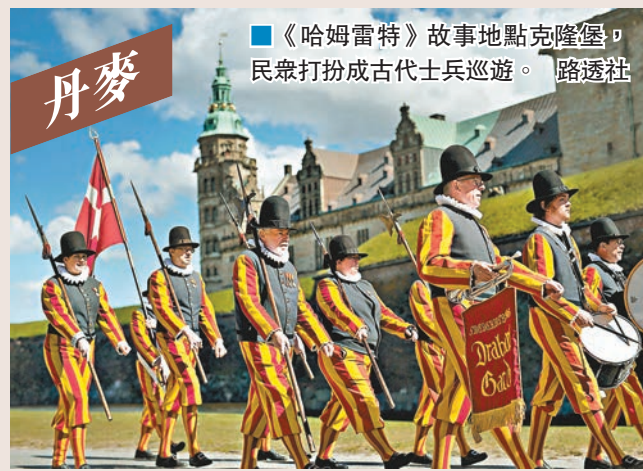
《哈姆雷特》故事地點克隆堡，民眾扮成古代士兵巡遊。