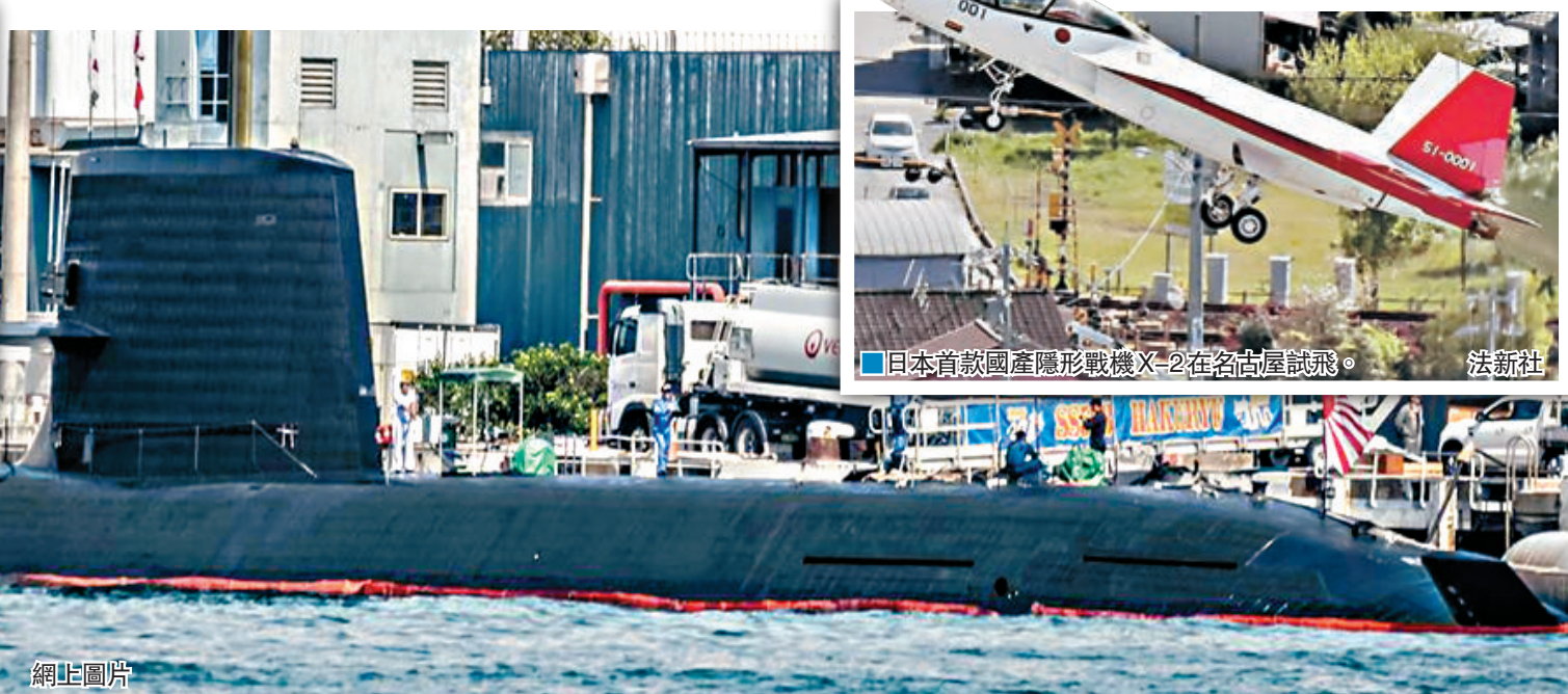
日本首架國產隱形戰機X-2在名古屋試飛。