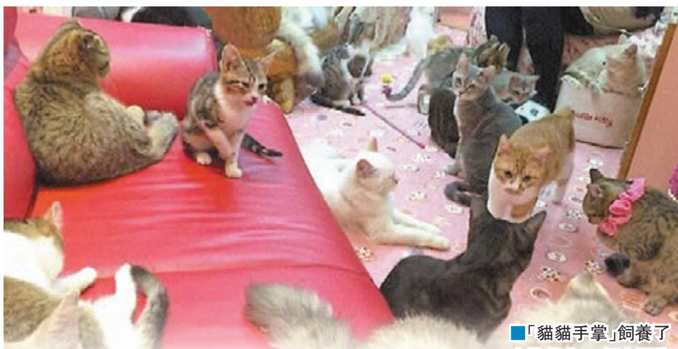
「貓貓手掌」飼養了大批貓咪。

日本近年出現不少貓Cafe，但因缺乏監管以致良莠不齊，東京墨田區一家名為「貓貓手掌」的貓Cafe，前日便因為店內環境極度惡劣，遭當局以涉嫌虐待動物為由勒令停業，是全國首例。報道指，「貓貓手掌」面積只有不足107平方呎，卻養了多達62隻貓，而且爆發傳染病，堪稱貓地獄。