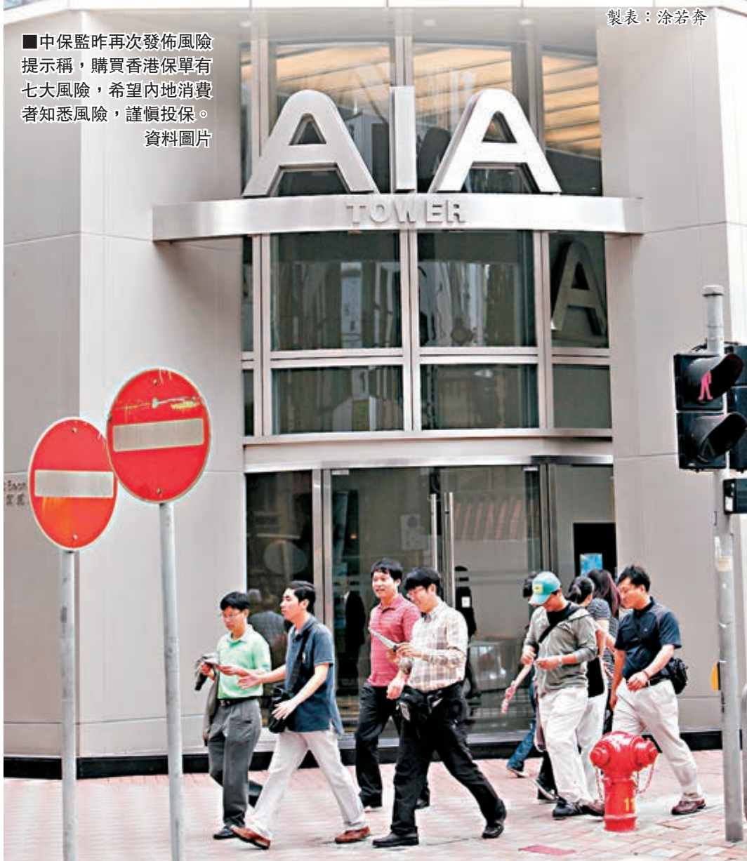
■中保監昨日再次發佈風險提示稱,購買香港保單有七大風險,希望內地消費者知悉風險,謹慎投保。 資料圖片