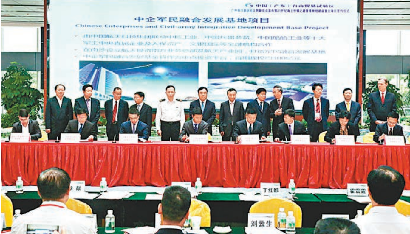
■ 南沙自貿區昨天與香港尚乘資產管理有限公司、廣東蓉勝超微線材股份有限公司、深圳市創盛資產管理有限公司就粵港合資全牌照證券公司項目簽約。

香港文匯報訊(記者 古寧 廣州報道) CEPA 項下廣東首家粵港兩地合資的全牌照證券公司敲定。南沙自貿區昨天與香港尚乘資產管理有限公司、廣東蓉勝超微線材股份有限公司、深圳市創盛資產管理有限公司簽署合作協議。