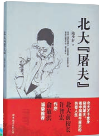
陸步軒新書《北大「屠夫」》的封面。

陸步軒坦言，過去忙於生計，所以壓力很大，「現在單位的工作也比較輕鬆，因為憑咱的語言修養，勝任這個工作是綽綽有餘的，在單位一年就是寫二三十萬字，許多任務都能超額完成，還能結餘不少時間」。