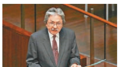
財政司司長曾俊華表示，樓價和經濟環境以及市民的負擔能力依然脫節。

市交投自去年7月起轉趨淡靜，樓價在去年10月起連跌五個月，至今年2月累計下跌約11%，市場數字顯示樓價在3月是持續下跌。