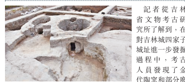
考古人員發現的陶窯遺址。

記者從吉林省文物考古研究所了解到，在對吉林城四家子城址進一步發掘過程中，考古人員發現了金代陶窯和部分廢棄陶片堆積。專家介紹，該窯址保存狀況較好，在國內同類型遺址中較為罕見。