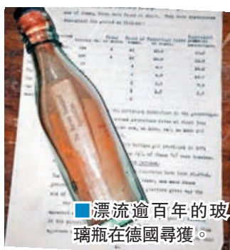
漂流逾百年的玻璃瓶在德國尋獲。