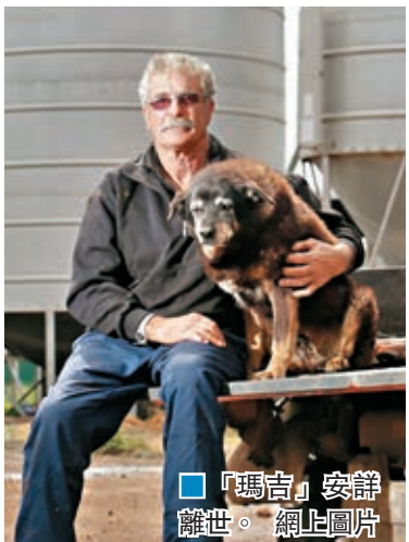
「瑪吉」安詳離世。網上圖片

狗隻平均壽命為8至15歲，能活過20歲是非常罕見，通常屬小型品種。現時健力士世界紀錄中的最長壽狗隻，為澳洲雌性牧羊犬「布呂伊」，牠於1939年以29歲高齡去世。