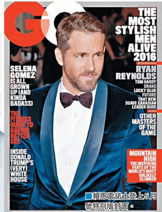
賴恩雷諾士登上5月號特別版封面。