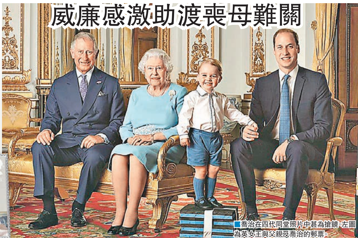
喬治在四代同堂照片中甚為搶鏡。左圖為英女王與父親及喬治的郵票。