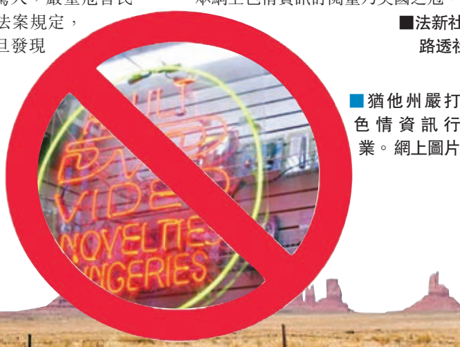
猶他州嚴打色情資訊行業。網上圖片