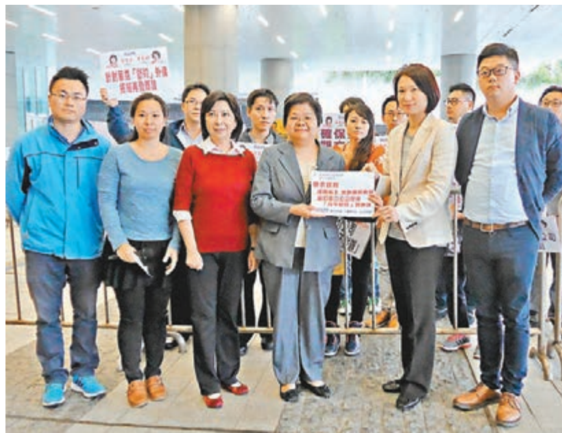
民建聯多名立法會議員及區議員昨日請願，要求政府研究加入外傭試用期，並加強巡查與投訴的調查工作，嚴打不良中介公司。

其餘建議包括規定外傭離職必須返回原居地；僱主終止合約須清晰交代外傭工作表現和離職原因，以便下次審批；將提前解約的外傭審查機制常規化；要求海關積極收集中介公司涉不良營商情報，主動調查與檢控；引入職業介紹所登記冊，供市民查閱中介的違法及不良記錄。